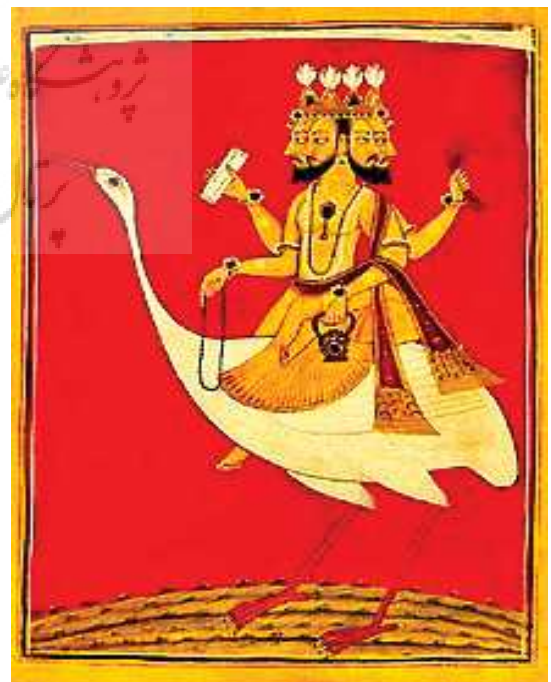
تصویر ۱۸. برهما سوار بر غاز، هند، اوایل ق ۱۸ م، مأخذ: URL:3