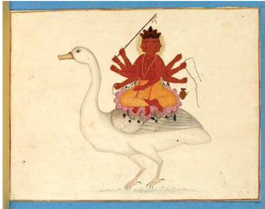
تصویر ۱۷. برهما سوار بر غاز، هند، اوایل ق ۱۹ م، مأخذ: URL:2