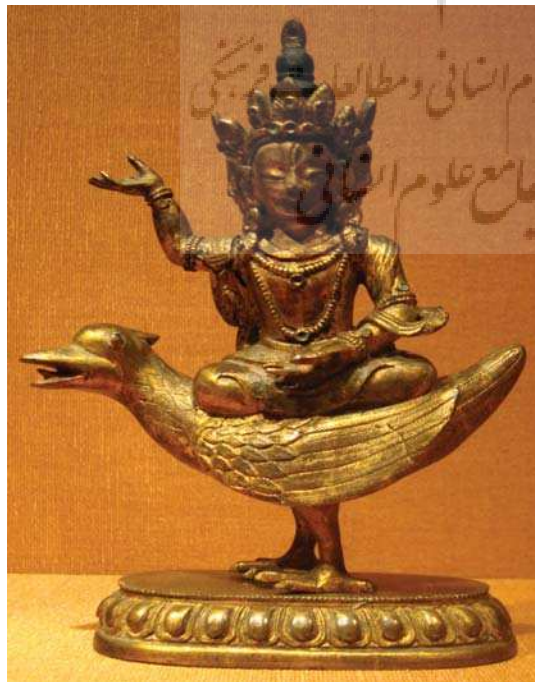
تصویر ۱۹. برهما سوار بر غاز، تبت، قرن ۱۷ و ۱۸ م، برنز

دیگری مانند عطارد رسیده است و عطارد سوار بر این پرنده است. (Pingree, 1989: 6,7) اما نکته قابل توجه در تصویر ۸، مشتری سوار بر پرنده‌ای است که متن آن را کرکس معرفی می‌کند، اما پرنده تصویر شده با پرنده‌ای که عطارد سوار بر آن است (تصویر ۱۵) کاملاً مشابه است. این پرنده احتمالاً باید از غاز مرکب برهما - خدای سیاره مشتری - الهام گرفته باشد و یا از گارودا پرنده افسانه‌ای،