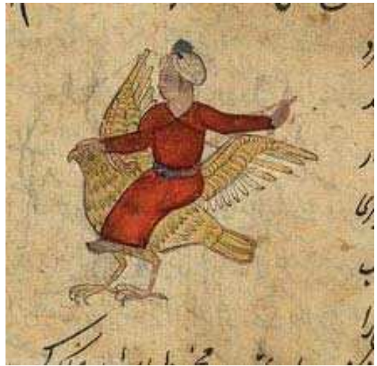
تصویر ۱۲. طلسم مشتری

در نسخه دیگری از این کتاب نیز همین تصویر با همان کاربرد را می‌بینیم که به جای مرد، زنی برهنه بر پرنده سوار است. (تصویر ۱۰) در نسخه متأخر دیگری که مجموعه‌ای در باب علوم غریبه