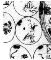
تصویر ۱۶. منطقه البروج در حال گردش به دور زمین و سایر سیارات

مرکب ویشنو که با سیاره عطارد در ارتباط است. (تصویر ۱۷ و ۱۸ و ۱۹) به نظر نمی‌رسد این پرنده از عقابی که در غرب سیاره مشتری را با آن تصویر می‌کنند، الهام گرفته باشد. (Pingree, 1989: 8) در باقی تصاویر نیز پرنده تصویر شده شباهت بیشتری به غاز دارد تا به عقاب و کرکس. در تصویری که در دقیق الحقایق نیز وجود دارد، مرد سوار بر مرغابی تصویر شده است که غاز و مرغابی از یک خانواده هستند و تشابه