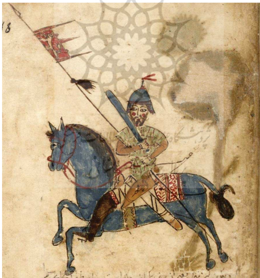
مرد سواره جنگجو

بررسی نگاره مرد سوار بر پرندۀ در نسخه خطی بقایق الحقایق نصیرالدین محمد معزم هیکلی با رویکرد شمایل شناسانه پانوفسکی / ۹۵-۱۱۱