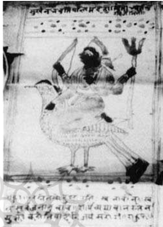
تصویر ۱۴. زحل سوار بر غاز

با یکی از خدایان مرتبط شده‌اند و بسیاری از ویژگی‌های خدایان به‌خصوص مرکب‌هایشان، به سیاره مرتبط با آن‌ها منسوب شده است. به بیانی سنت استفاده از حیوانی خاص به‌عنوان مرکب، به تصاویر نجومی هند راه می‌یابد. این در حالی است که نقش‌مایه‌هایی از این دست و به‌طور کلی نوشته‌ها و تصاویر نجومی هندی، از طریق حرانیان، به تصاویر جادویی و طلسم گونه اسلامی و اروپایی اضافه می‌شود. حرانیان که صائین نیز نامیده می‌شوند، در زمینه انتقال علوم غریبه به جهان اسلام نقش عمده‌ای داشتند. (ادهم، ۱۳۹۸: ۸۶ و ۸۷)