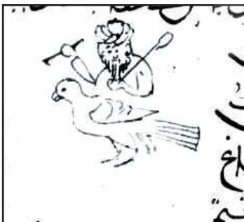
تصویر ۸. طلسم مشتری

می‌رسد دقایق الحقایق بیش از یک بخش باشد. بخش سوم یا آخر مونس العوارف و ورق‌های ۱۳۳ تا ۱۴۶ را تشکیل می‌دهد که به نظم تصنیف شده و جنگی مصور است. ابعاد هر برگ آن در حدود ۱۷۰×۲۵۵ میلی‌متر است که تقریباً ابعاد برگ‌های آن به ابعاد وزیری (۲۴۰ × ۱۶۰) نزدیک است. نسخه مذکور به خط نسخ و ثلث، با جوهر قهوه‌ای و در هر صفحه ۲۰ سطر نوشته شده است. عناوین به‌گونه‌ای متمایز نوشته شده است تا یافتن آن‌ها برای خواننده آسان بوده و به چشم آید.