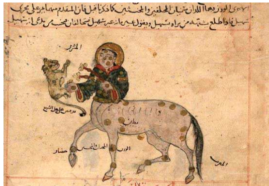
تصویر ۲. ستاره قنطورس