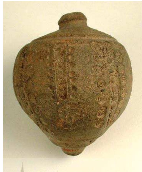
تصویر ۵. کوزه فقاع، نیشابور، ق ۱۱ و ۱۲ میلادی، مأخذ: موزه متروپولیتن 1: URL