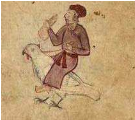
تصویر ۱۲. طلسم مشتری، مأخذ: تقویم نجومی ۱۳۰۱ ه.ق، کتابخانه ولکام لندن Wellcome Ms pers.373 fol90.v