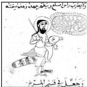
تصویر ۷. طلسم مشتری، مأخذ: کتاب سه‌بخشی جواهر الاحجار، خواص الاحجار و منافع الاحجار، ق ۱۰ و ۱۱ هـ.ق. کتابخانه ملی فرانسه، پاریس MS arab.2775, fol.129.v