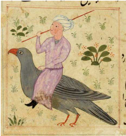
تصویر ۶. طلسم، مأخذ: عجایب المخلوقات، کتابخانه ملی فرانسه، پاریس MS Persan 332, fol.67r.

بررسی نگاره مرد سوار بر پرنده در نسخه خطی دقایق الحقایق نصیرالدین محمد معزم هیکلی با رویکرد شمایل شناسانه پانوفسکی / ۹۵-۱۱۱