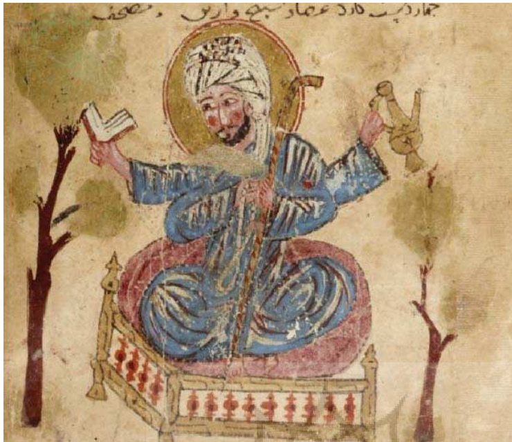
تصویر ۳. سیاره مشتری، مأخذ: همان: دقایق الحقایق. fol.109V.

طلسم، تعویذ و جادو را گردآوری، ترجمه و نگارش کرده است. در هیچ کدام از تحقیقات قبلی کتاب دقایق الحقایق و تصاویر آن به طور کامل بررسی نشده است.