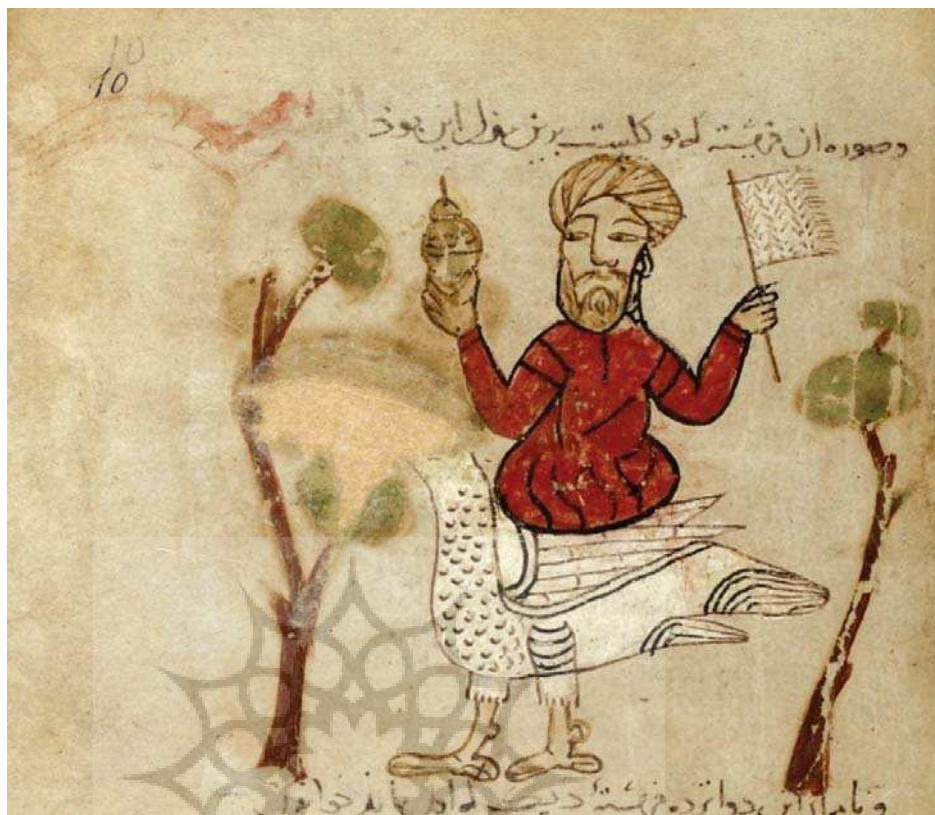
تصویر ۴. مرد سوار بر پرند، مأخذ: همان: fol. 10r.

دوم تشکیل می‌دهد. محل و سال کتابت بخش اول مشخص نیست ولی دقایق الحقایق در روز دوشنبه دهم رمضان سال ۶۷۰ در آق سرای و بخش سوم یا مونس العوارف نیز در شوال سال ۶۷۱ در قیصریه تألیف شده‌اند.