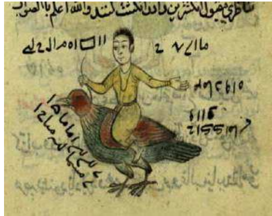
تصویر ۹. خاتم عطار، مأخذ: ذخیره اسکندری، کتابخانه مجلس، شماره ۶۸۴۱، برگه ۳۰.