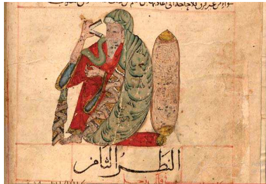
تصویر ۱. سیاره مشتری، مأخذ: عجایب المخلوقات قزوینی، ۱۷۸. MS cod.arab.464, fol. 16v، مأخذ: کتابخانه باواریا مونیخ.