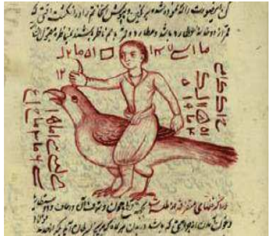
تصویر ۱۱. خاتم عطارد، مجموعه رسائل مختلفه در رمل و اسرار قاسمی، مأخذ: کتابخانه مجلس، شماره ۱۲۵۰۹، صفحه ۲۲۵

گمان بر گنج باشد چون این صورت را در آنجا بگذارند حرکت می‌کند». قسمت دوم که شامل مطالبی است که به علم احکام نجوم مربوط می‌شود. در متن کتاب در توضیح نقاشی مرد سوار بر پرنده آمده است: