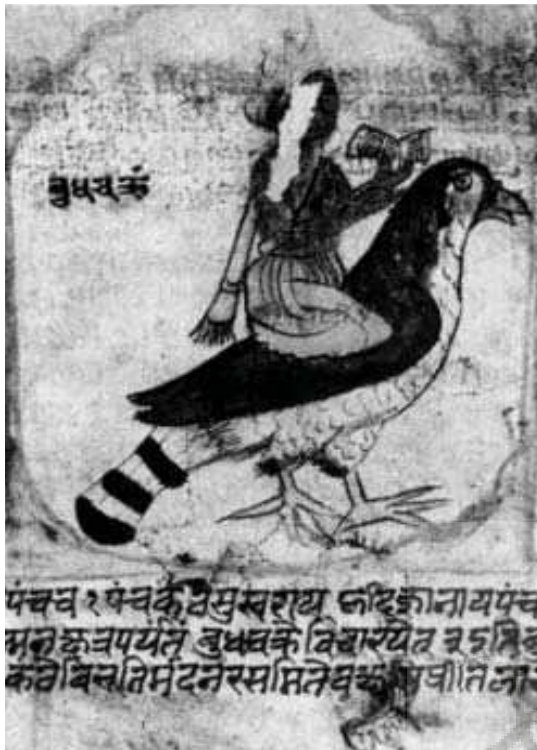
تصویر ۱۵. عطارد سوار بر غاز