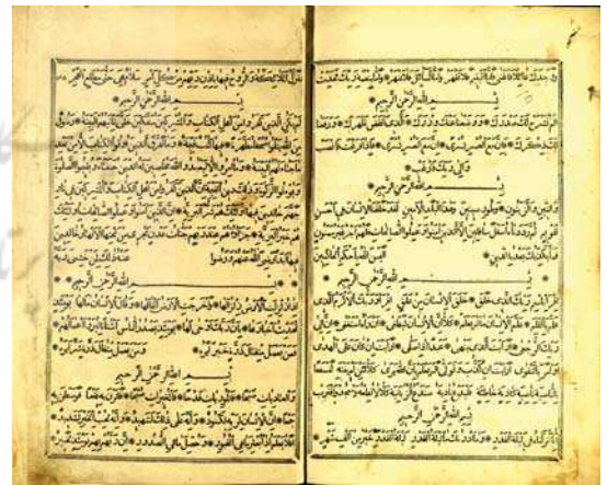
تصویر ۲. قرآن ۱۲۷۱ ق. (۱۸۵۵ م.)، طهران، مطبعه: عبدالکریم، برگ ۱۶۴ پ و ۱۶۵ ر، مأخذ: مشهد، کتابخانه آستان قدس رضوی

۴. طهران: سلخ شعبان ۱۲۴۷ ق. (۲ فوریه ۱۸۳۲ م.)، مطبعه: دارالخلافة طهران، (بسعی و اهتمام) جناب زین العابدین آتبریزی، (سرکاری) اسفندیارخان، حامی چاپ: منوچهرخان آگرچی (معتمدالدوله)، [صفحه و سطر: