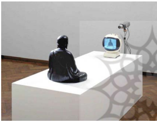
تصویر ۴- نام جون پایک، بودای تلویزیونی، ۱۹۷۶م. (URL 6).

و چیرگی رسانه‌های امروز را بر باورهای کهن به نمایش درآورد. او مجسمه‌ای از بودا متعلق به قرن هجدهم را روی یک میز که با پارچه‌ای سفید پوشانده شده - روبروی یک تلویزیون مدور قرار داده و با نصب یک دوربین مدار بسته، روبروی پیکره بودا و پشت صفحه تلویزیون، تصویر مجازی بودا را ضبط و هم‌زمان از تلویزیون پخش می‌نماید. مجسمه خیره به تصویر مجازی خود، گویا در اندیشه فرو رفته است. فضای مجازی، تعریف جدید بودا را به خود او عرضه می‌کند.