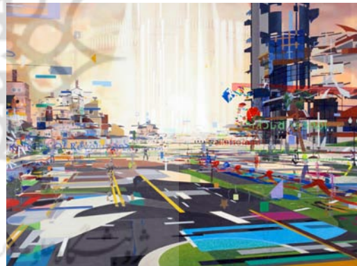
تصویر ۷- بنجامین ادواردز، دهکده پنهان، ۲۰۰۶ م.، رنگ روغن روی بوم (URL1).

تجربه شکست مکان و امتداد زمان در آثار ادواردز در موضوع منظره‌نگاری، بیش از سایر ژانرهای نقاشی، جلوه‌ای فراواقعی می‌یابد. نماهایی از مناظر متعدد که در تناوب زمانی، فضایی متکثر و چندوجهی را ایجاد نموده‌اند. بودریار در کتاب امریکا با حسرت از زوال نظم در رخدادهای امروزی و هم‌چنین، از ناپایداری معنا و دوام‌ناپذیری وقایع یاد می‌کند؛ «چیزها بیش از مدت زمان وقوع خود دوام نمی‌آورند. [...] امکان بازگشت ابدی در حال متزلزل شدن است؛ آن چشم‌انداز شگفت‌آور مستلزم این است که، چیزها با نظم و ترتیبی از پیش مقدر و ضروری رخ دهند، نظم و ترتیبی که معنایی فراتر از خود آن‌ها داشته باشد. امروز چنین نیست؛ چیزها صرفاً با نظم و ترتیبی متزلزل از پس یک‌دیگر می‌آیند، نظم و ترتیبی که به جایی نمی‌انجامد» (بودریار، ۱۳۸۴ الف: ۹۷).