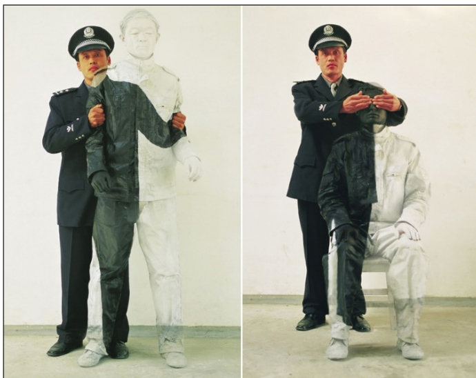
تصویر ۱- لیو بولین، پلیس، ۲۰۰۱ م. (URL3).

از راه تقلید نشانه‌های دیگر ایجاد می‌شوند؛ و بدین ترتیب، بودریار حاکمیت مطلق و انموده‌ها و نابودی واقعیت را در جهان امروزی اعلام می‌دارد.