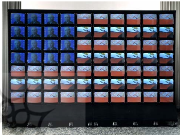
تصویر ۵- نام جون پایک، پرچم ویدئویی، ۱۹۶۸ م. (URL5).

رایج فرهنگ والا باقی بمانید، به مطلب ضروری و ذاتی پی نمی برید که، دقیقاً، غیر ضروری و غیر ذاتی است» (بودریار، ۱۳۸۴ الف: ۱۳۳). پایک، در اثری دیگری با عنوان پرچم تلویزیونی، (تصویر ۵)، مساله ملیت و هویت ملی را در عصر سلطه فضای مجازی به نمایش درآورده و از سلطه نظام رسانه ای مجازی بر قدرت های بزرگ سیاسی پرده برمی دارد.