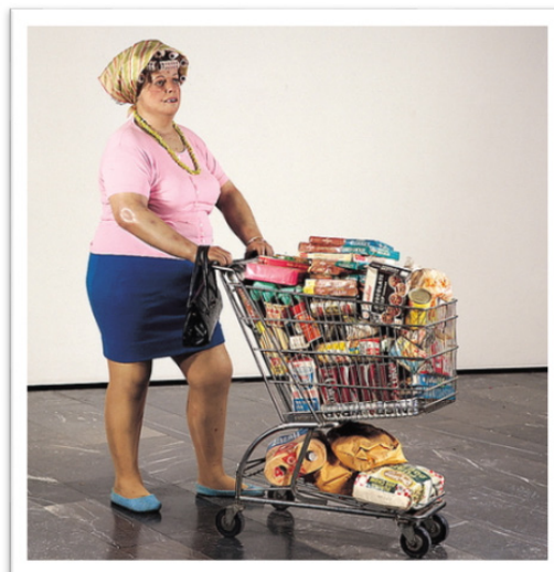
تصویر ۲- دوآن هانسون، زن یا سبد خرید، ۱۹۷۰ م. (Luci-Smith, 2002: 483).

تصویر ۳، نمونه‌ای از نقاشی هایپررئالیستی را نشان می‌دهد. این اثر که متعلق به دان ادی متولد ۱۹۴۴ م. است، تقریباً هم‌زمان با اثر زن با سبد خرید هانسون، خلق شده است. موضوع اثر در عین آشنا و عمومی بودن، صحنه‌ای پیچیده و متداخل را بازمی‌نماید. ادی در آثار خود می‌کوشد، تا با برهم زدن پلان‌های تصویری و به چالش کشیدن چیرستی موضوع نقاشی، رابطه انسان و فضا را به صورتی معماگونه، پیچیده و متکثر باز نماید. او با ایجاد توهم واقعیت، فضایی را در آثارش خلق کند که تجربه‌ای چندوجهی و متکثر از واقعیت در هم ریخته معاصر را به منصفه ظهور می‌رسانند. نقاشی‌های ادی به تک‌شات‌هایی از یک روایت می‌مانند؛ روایتی از مصرف‌گرایی زندگی معاصر. در عین حال، حداقل سه ساحت مختلف را هم‌زمان به تصویر در می‌آورد؛ شیشه ویتترین مغازه به عنوان پلان اول تصویر، شفافیت سطح شیشه، که سبب ظهور اشیای پشت ویتترین گردیده، پلان دوم تصویر را ایجاد می‌کند و انعکاس محیط اطراف، ساختمان‌های پشت سر و فضای خیابان پلان سوم را در موقعیت معکوس باز می‌نماید. نکته قابل تامل، وضوح و دقت در جزییات هر یک از این سه پلان تصویری در نقاشی حاضر است. به دلیل نوع عملکرد قوه بینایی انسان، در حالت