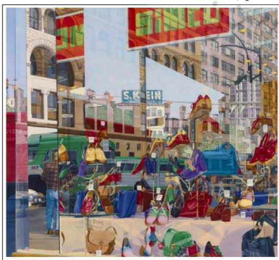
تصویر ۳- دان ادی، کفش‌های جدید برای H، ۱۹۷۳ م. اکرولیک روی بوم (URL2).

طبیعی هرگز هر سه این پلان‌ها را نمی‌توان هم‌زمان به صورت واضح مشاهده نمود؛ این امر از لحاظ قابلیت‌های بینایی چشم انسان ناممکن است. ادی برای آفرینش این صحنه از چند عکس مختلف که در هر یک از آن‌ها عدسی دوربین بر روی یکی از پلان‌ها وضوح یافته است، بهره‌گرفته و با ترکیب اطلاعات به دست آمده و تلفیق آن‌ها در یک تصویر واحد، صحنه‌ای فراواقعی را به نمایش درآورده است. در این نقاشی مفاهیمی هم‌چون فضا، بُعد، فاصله و پلان‌بندی - که از مبانی خلق نقاشی هستند - برهم خورده‌اند و مصادیق آن با نوعی از آمیزش و درهم‌تنیدگی واقعیت ظاهر شده‌اند. آثار ادی را می‌توان بیش‌واقعی دانست که می‌کوشد معنایی عمیق‌تر از واقعیت و دلالت واقعی را نمایش دهد. گفته بودریار را به یاد می‌آوریم که: «امر حادواقعی نماینده مرحله‌ای بسیار پیشرفته‌تر است، مرحله‌ای که تضاد امور واقعی و خیالی در آن محو می‌شود. ناواقعیت دیگر به رویا یا خیال، به فراسوها یا به درون‌نگری نهانی تعلق نداشته، بل که به شباهت و هم‌اندیشانه امر واقعی با خود تعلق دارد. [...] طرحی که در این جا مطرح است بناکردن خلایبی پیرامون امر واقعی، زدودن کل روان‌شناسی و ذهنیت از اثر به منظور بخشیدن عینیتی محض به آن است» (بودریار، ۱۳۸۱: ۲۳). اصالت رسانه و فضای مجازی