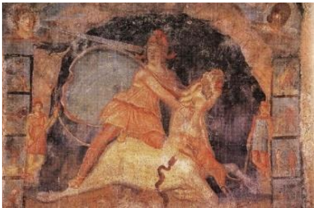
تصویر ۲. صحنه گاوکشی میترا. نقاشی رو گچ، ایتالیا.