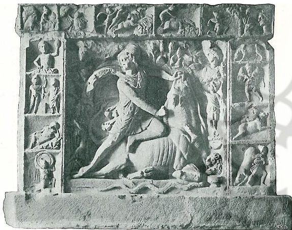
تصویر ۳. ذبح گاو توسط میترا، حجاری، آلمان.

همراهی گودرز و توس با برآوردن آوای کوس به مازندران لشکر کشیدند و چون خبر به شاه مازندران رسید، دیو سفید را برای نبرد با آنان فراخواند. دیو بسیاری از لشکر ایران را اسیر کرد، کیکاووس را به بند کشید و او را با دیگر سپاهیان کور کرد. چون خبر به رستم رسید رخس را زین کرد و به نجات کیکاووس شتافت، دیو سفید را که در غاری خفته بود یافته، زمین افکند و پهلویش را شکافت و از خون جگرش در چشمان کیکاووس و افراد دربند ریخت که بینایی را به آنان بازگرداند. نبرد رستم و دیو سفید در فرهنگ و تمدن ایران سابقه تاریخی داشته و در هنرهای مختلف، اعم از نگارگری، نقش کاشی، چاپ سنگی و ... در دوره‌های مختلف تا دوره قاجار قابل مشاهده است (جدول ۱).