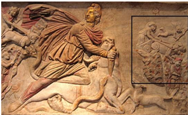
تصویر ۴. در کنار صحنه قربانی گاو میترا سوار بر گردونه چهار اسب خویش به آسمان می‌رود.

در بررسی و تحلیل موضوع نبرد رستم با دیو سفید و قربانی گاو توسط میترا با استناد به روایات شاهنامه فردوسی و مستندات و شواهد آیین میترای، هم‌چنین تصاویر منتخب از هر دو صحنه و تحلیل تصاویر منتخب معلوم شد که نقاشی