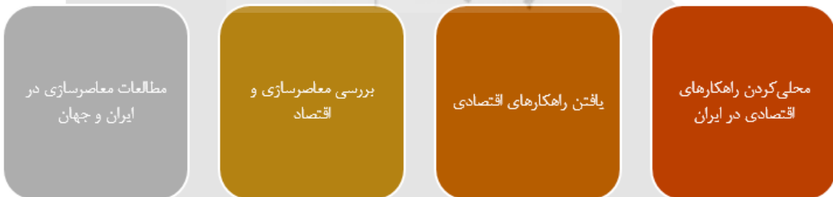
تصویر ۲. روند انجام پژوهش.

پژوهشگاه علوم انسانی و مطالعات فرهنگی پرتال جامع علوم انسانی