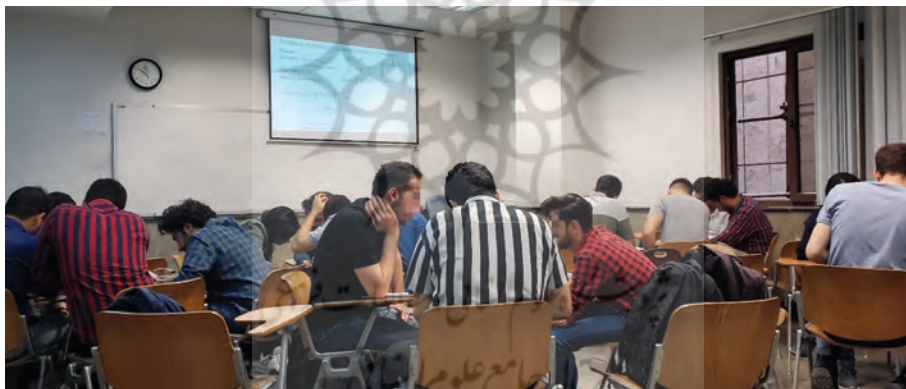
شکل ۲. نمونه‌ای از فضای کلاس ضمن یادگیری فعال، نوع فعالیت: یادگیری بخشی از درس که مشابه بخش‌های آموزش داده شده توسط استاد است. کلاس ترمودینامیک مهندسی شیمی پیشرفته کارشناسی ارشد دانشکده مهندسی شیمی، دانشگاه صنعتی امیرکبیر

و کسر مولی فاز بخار با داشتن دما و کسر مولی فاز مایع، یادگیری انواع دیگر محاسبات تعادل بخار-مایع در قالب مباحثات گروهی اتفاق می‌افتد. در طی این نوع فعالیت کلاسی، استاد در کلاس و بین گروه‌ها حرکت می‌کند و به تسهیل فرایند یادگیری و رفع اشکال می‌پردازد. شکل ۲ نمونه‌ای از فضای کلاس ضمن انجام این نوع از فعالیت را نمایش می‌دهد. معمولاً پایان فعالیت با جمع‌بندی توسط یکی از دانشجویان و ذکر نکات احتمالی و اصلاحات لازم توسط استاد همراه است. نمونه دیگر فکرکردن و تحلیل مسیر حل یک مسئله به صورت فردی یا گروهی بر اساس درس همان جلسه است. در برخی از جلسات، در ابتدای کلاس و پیش از مرور درس جلسه قبل، از هر دانشجو خواسته می‌شود در یک یا دو جمله، موردی که از درس جلسه گذشته یا مطالعه معین شده قبل از کلاس متوجه نشده است را بنویسد. در ادامه فرصت چنددقیقه‌ای داده شود که دانشجویان در قالب گروه‌های دونفره یا بزرگتر، در رابطه با این موارد مباحثه کنند. برای جلوگیری از استرس در دانشجویان، تأکید بر فضای امن کلاس و ایجاد فضایی به دور از توهین، سرزنش یا قضاوت در صورت پاسخ اشتباه، تأکید بر فرصت یادگیری و تشویق دانشجویان، کمک‌کننده است.