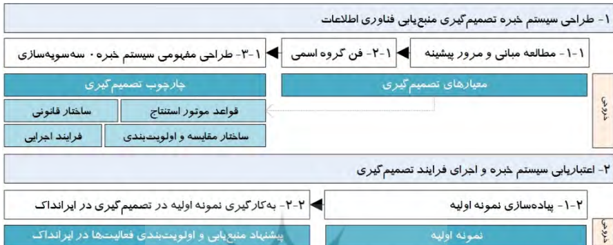
شکل ۱. گام‌های اصلی پژوهش

علوم و فناوری اطلاعات ایران» است که مؤسسه پژوهشی زیر نظر «وزارت علوم، تحقیقات و فناوری» است و در پنج مأموریت ۱- پژوهش، ۲- آموزش، ۳- مدیریت اطلاعات علمی و فناوریانه، ۴- پشتیبانی از سیاست‌گذاری علم و فناوری، و ۵- همکاری و هماهنگی مشغول به فعالیت است. این پژوهش در دو گام اصلی به شرح شکل ۱، انجام شده است.