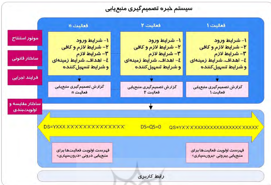
شکل ۲. چارچوب کلی تصمیم‌گیری منبع‌یابی مبتنی بر سیستم خبره