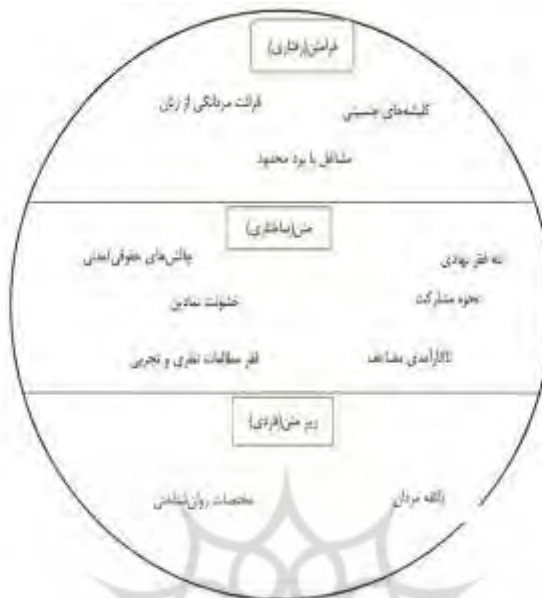
شکل ۲. ابعاد و مؤلفه‌های خشونت شریک صمیمی