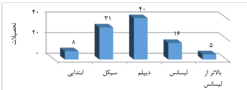
نمودار ۱. درصد فراوانی تحصیلات افراد مورد مطالعه