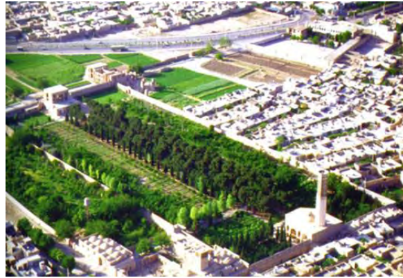
تصویر (۱): اندرونی باغ دولت‌آباد

علاوه بر توضیحات فوق، اصول پایداری محیطی در طراحی منظر مناطق اقلیمی گرم و خشک، درسه نظام