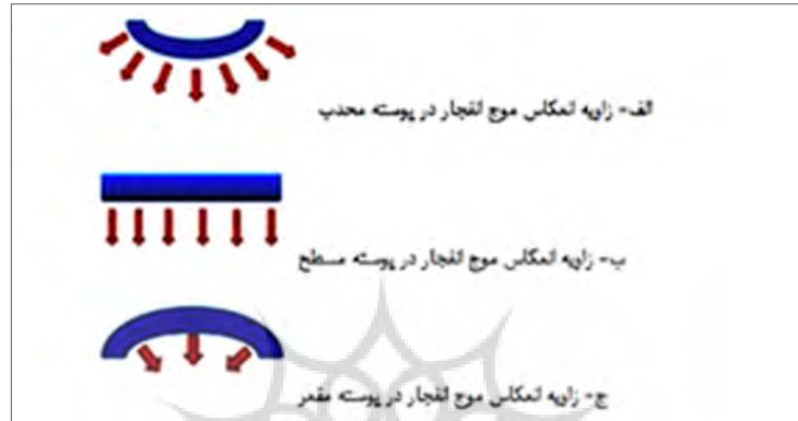
تصویر (۱): زوایای انعکاس موج انفجار در برخورد با فرم‌های مختلف، (منبع حسینی و همکاران ۱۳۹۲)

برابر انفجار نشان داده است که فرم‌های محدب بیشتر از پوسته مسطح و پوسته مسطح بیشتر از پوسته مقعر در برابر انفجار مقاومت نشان می‌دهند (حسینی و همکاران، ۱۳۹۲). خصوصیات آئرو دینامیکی مناسب فرم‌های گرد و محدب باعث ایجاد پایداری بیشتر آنها در برابر هرگونه موج می‌شود. این فرم‌ها به راحتی امواج را از