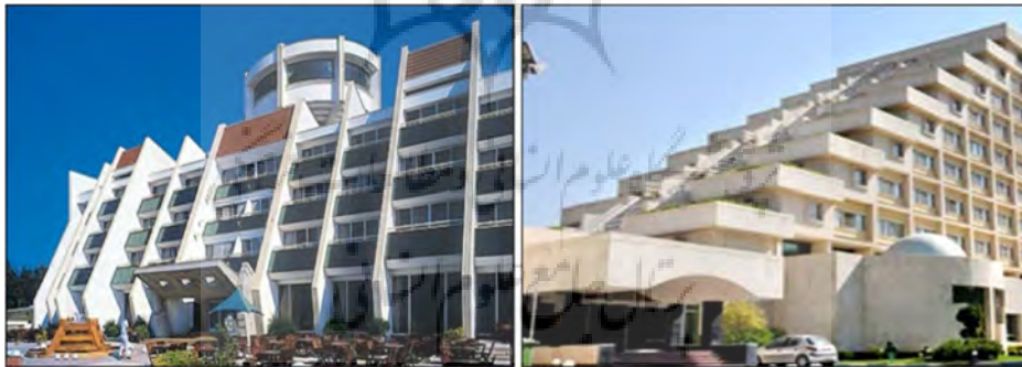
تصویر (۵): فرم مورب یا پلکانی جهت کنترل ریزش آوار (سازمان پدافند غیرعامل کشور، ۱۳۹۲)

شدت فشار منعکس شده بر سطح یک ساختمان مدور کمتر از یک ساختمان مسطح است. هنگام استفاده از سطوح منحنی، فرم‌های محدب به فرم‌های مقعر برتری دارند. در صورتی که توده ساختمان‌ها بر روی پیلوت‌هایی که حداقل از سه طرف شفاف باشند، احداث شوند، این گونه پیلوت‌ها به تخلیه سریع نیروهای انفجاری از زیر ساختمان کمک نموده و آثار تخریبی نیروهای انفجاری