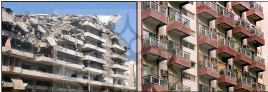
تصویر (۴): پرهیز از تراس‌ها و بالکن‌های ناپایدار با گوشه‌های تیز (سازمان پدافند غیرعامل کشور، ۱۳۹۲)

دیوارهای ضد انفجار، استفاده از پنجره‌های کمتر یا کوچکتر موجب می‌شود که موج انفجار کمتری وارد ساختمان شود، بنابراین به کاهش خسارات داخلی و مصدومیت‌ها منجر می‌گردد. از آنجا که طبقه همکف ساختمان قسمت اتصال به زمین یا کف پیاده‌رو است، طبقه همکف اهمیت ویژه‌ای در مقابله با آثار انفجار دارد. از این رو نما و فرم این قسمت دارای اهمیت زیادی است و مصالح مورد استفاده در این قسمت باید نسبت به بقیه ساختمان با دوام‌تر و مستحکم‌تر باشد. به دلیل اهمیت و تاثیر انفجار در نمای بیمارستان‌ها، وجود تراس‌ها و بالکن‌ها