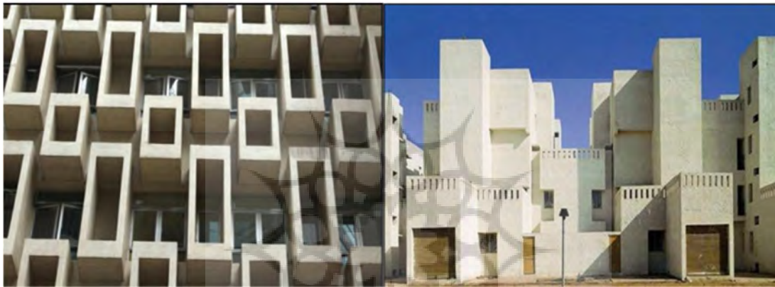
تصویر (۶): فضاهاى پر و خالى (سازمان پدافند غير عامل کشور، ۱۳۹۲)

میزان تنش ماکزیمم و مساحت آن در فرم مخروطی نیز کمتر از فرم کروی است که این عوامل می‌تواند باعث جذب کمتر انرژی انفجار در فرم مخروطی نسبت فرم کروی گردد و در نتیجه فرم مخروطی سازگارترین فرم پایه از منظر دفاع غیر عامل است. از آنجا که انتخاب فرم ساختمان بایستی توجه فنی و اقتصادی نیز داشته باشد،