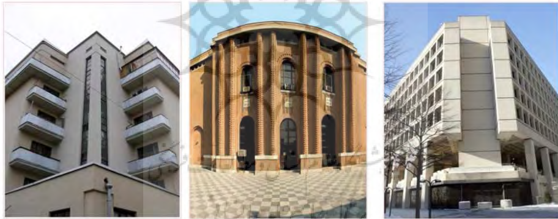
تصویر (۳): پرهیز از گوشه‌های تیز در گوشه‌ها و طبقات همکف و اول، (سازمان پدافند غیرعامل کشور، ۱۳۹۲)

ساختمان دارد. به طور مثال در مورد شکل و فرم یک ساختمان باریک و طویل اگر از قسمت باریک خود در معرض موج انفجاری قرار گیرد خسارت کمتری خواهد دید تا از قسمت پهن در معرض موج قرار گیرد. در رابطه با انفجار و تاثیر آن بر حجم و فرم ساختمان می‌توان تاکید کرد که فرم‌های افقی و خوابیده در مرحله اول و فرم‌های با تناسب مساوی در مرحله دوم نسبت به فرم‌های عمودی و ایستاده دارای مقاومت و پایداری بیشتری است، زیرا افزایش ارتفاع از سطح زمین و فرم‌های کشیده مرتفع باعث آسیب‌پذیری بیشتر در برابر انفجار می‌شود. همچنین می‌توان برای عبور موج انفجار از فرم‌های نرم (آیرودینامیک) استفاده نمود زیرا فرم‌های هندسی و غیر آیرودینامیک باعث افزایش تخریب در اثر موج انفجار می‌گردد. حجم کلی و فرم