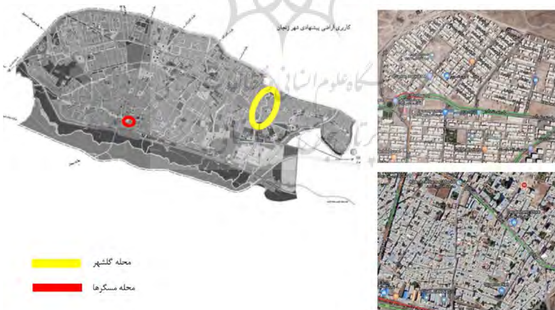
تصویر (۱): محله گلشهر (راست، بالا) و محله مسگرها (چپ، پایین)، زنجان.

محله نوساز گلشهر: یکی از بزرگترین محله‌های نوساز شهری کشور با وسعت ۴۰۰ هکتار و دارای بیش از