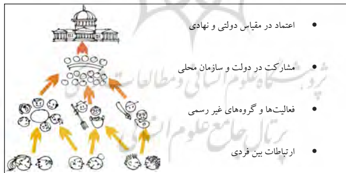
نمودار (۱): سلسله مراتب سرمایه اجتماعی، بولینگ یک نفره، رابرت پاتنم

واژه سرمایه اجتماعی برای اولین بار در سال ۱۹۱۶ در مقاله لیدا جی هاینفان از دانشگاه ویرجینیای غربی مطرح شد (صادقی‌شاهدانی و مقصودی، ۱۳۸۹). در دهه‌ی ۱۹۶۰ جین جیکوبز این مفهوم را بسط داد و برای تاکید بر ارزش‌های جمعی در همبستگی غیر رسمی همسایگی در مادرشهرهای جدید امریکایی به کار برد (زند رضوی و همکاران، ۱۳۸۸). رابرت پاتنم، دانشمند علوم سیاسی آمریکایی، مفهوم سرمایه اجتماعی را از قلمرو انتزاعی نظریه اجتماعی و اقتصادی به سطح جامعه منتقل کرد (جان فیلد، ۱۳۸۵). وی در کتاب بولینگ یک نفره، با یادآوری خطر فردگرایی و کاهش سرمایه اجتماعی در امریکا می‌نویسد: یک مرد سیاه پوست ۵۰ ساله در ایالت میسیگان که در لیست انتظار دریافت کلیه است از جوان ۳۳ ساله سفید پوست امریکایی - که مثل خود بیمار، سابقه عضویت در باشگاه بولینگ محله را دارد - کلیه اهدایی دریافت کرد. پاتنم با تکیه بر واقعه فوق،