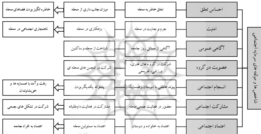
نمودار (۲): شاخص‌ها و مولفه‌های سرمایه اجتماعی

(ی) احساس تعلق: احساس تعلق و پیوند عاطفی با دیگران، نیازی انسانی است. حس تعلق به گروه، بر