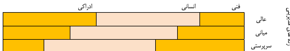
شکل ۱: میزان نسبی مهارت‌های مورد نیاز در رده‌های مختلف مدیریت (علاقه بند، ۱۳۹۵)

تفکر انتقادی ۱ فرایندی ذهنی است که منتج به قضاوت و تصمیم‌گیری در مورد عقاید، اعمال و موضوعات می‌گردد و فرد را قادر می‌سازد که جنبه‌های مختلف یک پدیده یا مساله یا چند پدیده را در نظر بگیرد و مبنی بر دلایل معتبر در مورد آنها قضاوت نماید (کارشکی، ۱۳۸۴).