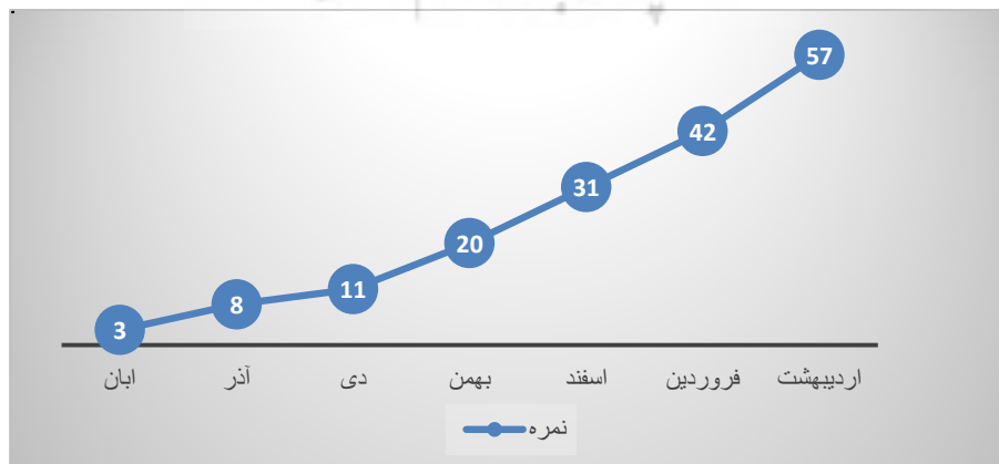
نمودار شماره ۳: مقایسه محاسبه سرعت خواندن قبل و بعد از اجرای روش آزمایشی