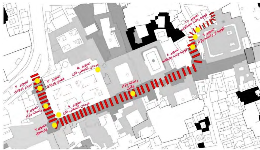
تصویر ۱. پلان مجموعه گنجعلیخان و مسیر حرکتی

را به سمت دایره هدایت می‌کند که قانون بستگی را نمایان می‌سازد (تصویر ۳-۱).