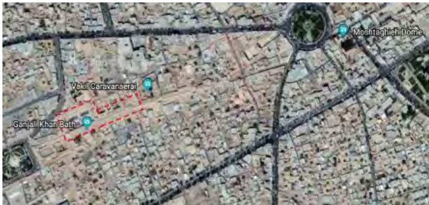
تصویر ۱- محدوده مورد مطالعه بخش اول

بخش دوم مورد مطالعه در محدوده غرب شهر کرمان تحت عنوان محله الغدیر که به عنوان محله‌ای مدرن قرار گرفته است. این محله در یکی از بلوارهای اصلی شهر کرمان (بلوار جمهوری) قرار دارد. در دهه‌های اخیر گسترش کرمان در راستای بلوار جمهوری صورت گرفته که جمعیت زیادی در حال حاضر در این محدوده سکونت دارند. از اماکن شاخصی که در محدوده این محله وجود دارد می‌توان به مجموعه ورزشی امام علی (ع)، برج تجاری، ادارات دولتی، شرکت‌های خصوصی و شهرک‌های مسکونی می‌توان اشاره نمود (تصویر ۲).