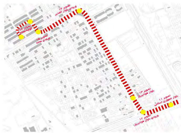
تصویر ۱۱. پلان محله الغدير و مسیر حرکتی

بلوار جمهوری اسلامی امکان دسترسی را به بلوار هوانیروز و محله الغدير را فراهم می‌کند (تصویر ۱۲). همان‌طور که مشاهده می‌شود ورودی شاخص نبوده و دارای علائم و نشانه‌ای نیست که این عامل خود باعث پیچیدگی مسیریابی رهگذران می‌شود.