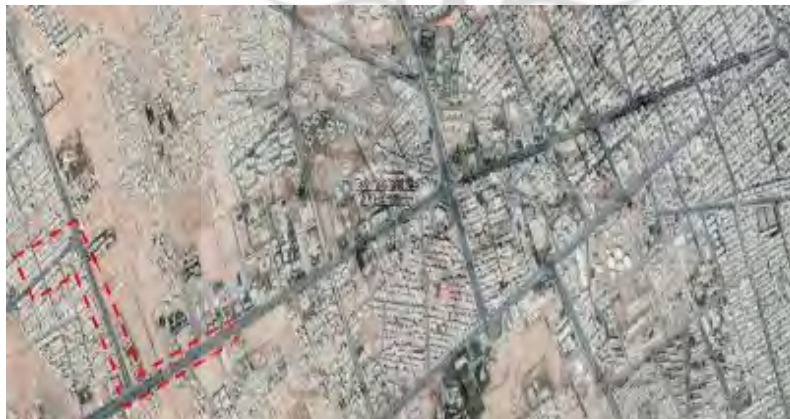
تصویر ۲- محدوده مورد مطالعه بخش دوم (Google Earth, 09/04/2019)

بخش دوم مورد مطالعه در محدوده غرب شهر کرمان تحت عنوان محله الغدیر که به عنوان محله‌ای مدرن قرار گرفته است. این محله در یکی از بلوارهای اصلی شهر کرمان (بلوار جمهوری) قرار دارد. در دهه‌های اخیر گسترش کرمان در راستای بلوار جمهوری صورت گرفته که جمعیت زیادی در حال حاضر در این محدوده سکونت دارند. از اماکن شاخصی که در محدوده این محله وجود دارد می‌توان به مجموعه ورزشی امام علی (ع)، برج تجاری، ادارات دولتی، شرکت‌های خصوصی و شهرک‌های مسکونی می‌توان اشاره نمود (تصویر ۲).