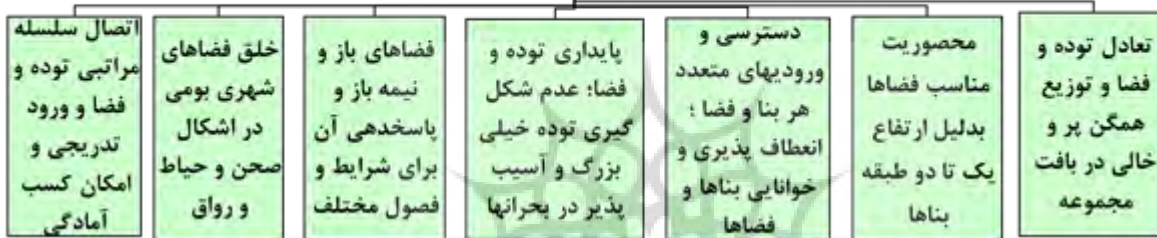
شکل ۳- ویژگی‌های الگوی توده و فضای مجموعه بقاع متبرکه و حرم امامزادگان (نگارنده)