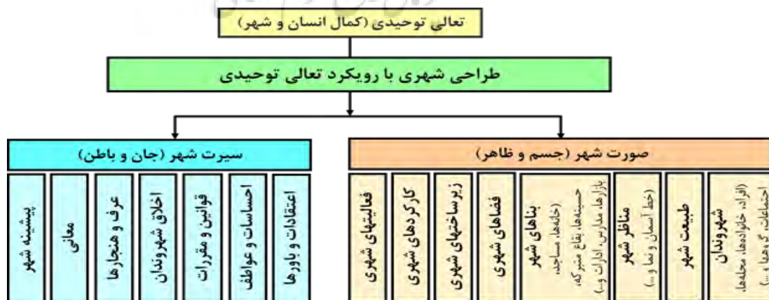
شکل ۱- مؤلفه‌های طراحی شهری با رویکرد تعالی توحیدی (نگارنده)