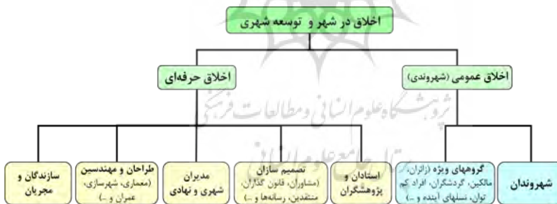
شکل ۲- دسته‌بندی اخلاق در شهر و شهرسازی (نگارنده)

اخلاق حرفه‌ای گونه‌ای از اخلاق کاربردی می‌باشد که به بررسی چالش‌های اخلاقی‌ای که توسط شاغلین فنون و حرفه‌ها، هنرمندان، پزشکان، وکلا، کارگران و ... تجربه می‌شوند، می‌پردازد و به دنبال مطالعه و فهم مبانی ارزش‌ها و الزامات حرفه‌ای و مسئولیت اخلاقی فرد است. مسئولیت‌های سه‌گانه: ۱- فرد در قبال خود و دیگران در زندگی شخصی ۲- در قبال خود و دیگران در زندگی شغلی ۳- صنف و سازمان در قبال محیط داخلی و خارجی. اخلاق حرفه‌ای به منزله شاخه‌ای از دانش اخلاق به بررسی تکالیف اخلاقی در یک حرفه و مسائل اخلاقی آن می‌پردازد و در تعریف حرفه، آن را فعالیت معینی می‌دانند که موجب هدایت فرد به موقعیت تعیین شده همراه با اخلاق خاص است (قراملکی، ۱۳۸۵: ۱۳۷).