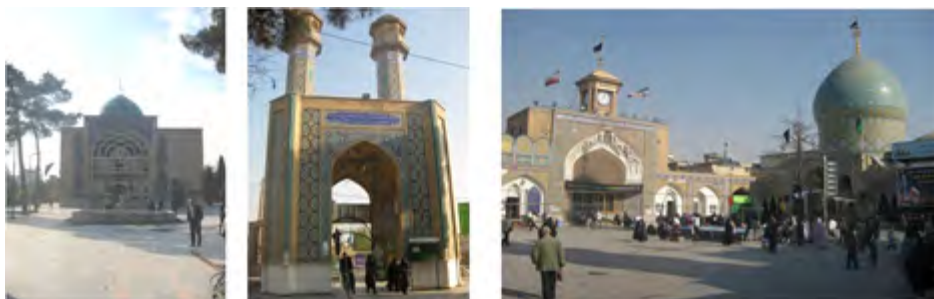
شکل ۴- فضاهای مذهبی شهرداری و اجزای آن‌ها به‌عنوان نشانه‌هایی مهم در تصویر ذهنی شهروندان: حرم حضرت شاه عبدالعظیم نشانه‌ای مهم در تصویر ذهنی مردم ری و تهران (راست)؛ ورودی امامزاده عبدالله شهرداری (وسط)؛ آرامگاهی در ابن بابویه، شهرداری (چپ)

معانی و آثار ارزشمند در مسیر هجرت امام رضا (ع) می‌باشند. این معارف به‌عنوان نشانه‌های حقیقی قابل نشر و گسترش در سرتاسر سرزمین ایران هستند. تجلی این نشانه‌ها در زندگی مردم و ابعاد مختلف جامعه ایرانی-اسلامی و نیز به‌صورت نمادهای فرهنگی، هنری و فضاهای فرهنگی، آموزشی و پژوهشی، فرصتی مهم برای بهره‌گیری از این معارف می‌باشد.