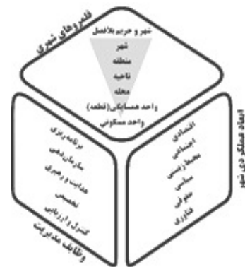
نمودار ۲- ابعاد مفهومی حکمروایی ساخت‌وساز در شهر تهران