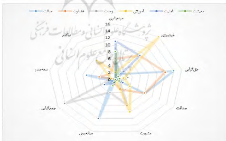
شکل ۲- ارتباط درون متنی معیارهای حکومت و صفات اخلاقی حاکم در آرای منتخب از نهج البلاغه