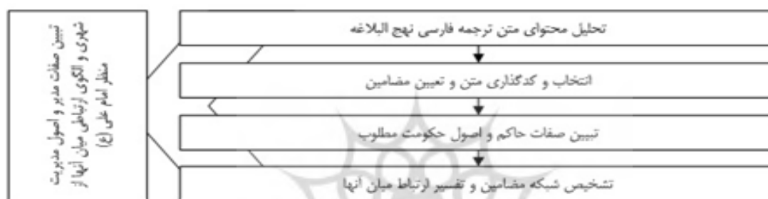
شکل ۱- مدل مفهومی روش تحقیق