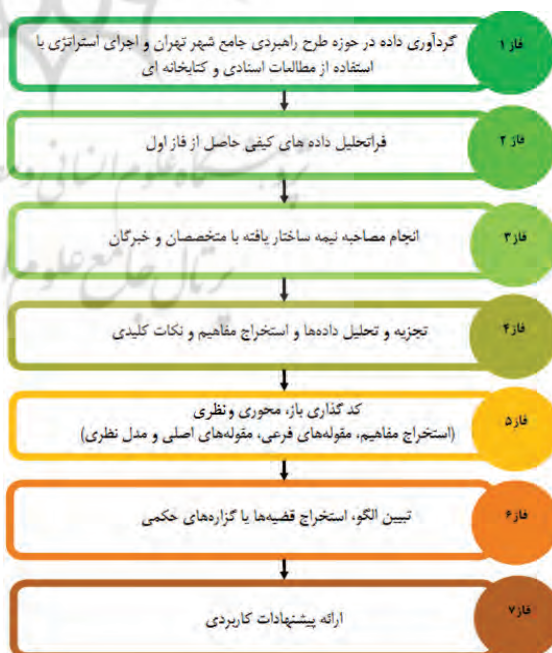
شکل شماره (۱): فرآیند اجرایی پژوهش

فرآیند تحلیل شامل استراتژی‌های کدگذاری، یعنی خرد کردن مصاحبه‌ها و دیگر شکل‌های داده‌ها به واحدهای معنایی مجزایی که به منظور خلق مفاهیم برای آن‌ها عناوینی در نظر گرفته می‌شود، است. این مفاهیم در ابتدا در مقوله‌هایی توصیفی خوشه‌بندی شدند، سپس بر مبنای روابط متقابل ارزیابی مجدد گشتند و از طریق مجموعه‌ای از گام‌های تحلیلی به تدریج درون مقوله‌های سطح بالاتر یا محوری قرار گرفتند. سپس از طریق فرآیند کدگذاری نظری خط سیر داستان بیان شد. چرایی‌ها تشریح شده و مدل کلی پژوهش تبیین شد.