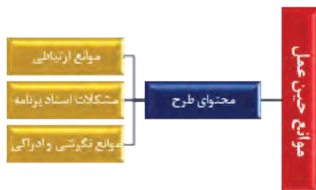
شکل شماره (۴): موانع حین عمل اجرای طرح جامع راهبردی

طرح راهبردی، بیان چشم‌اندازها، اهداف، سیاست‌ها، راهبردها و اولویت‌های عملی و اجرایی در مقیاس کلان‌شهری و یا منطقه شهری است، تمامی این فعالیت‌ها، محتوای طرح‌های راهبردی را تشکیل می‌دهند که نتیجه و خروجی آن، اسنادی هستند که پس از تصویب در قالب مجموعه‌ای از فرآیندها، به عنوان راهنمای عملی امور شهری بکار گرفته می‌شوند. در تهیه طرح‌های راهبردی و تولید محتوای این طرح‌ها، رعایت برخی الزامات ضروری است. الزاماتی که در صورت عدم رعایت هر یک از آنها، اجرای برنامه‌ها را با چالش‌های فراوانی مواجه می‌سازد. برخی از مهمترین این الزامات عبارتند از: