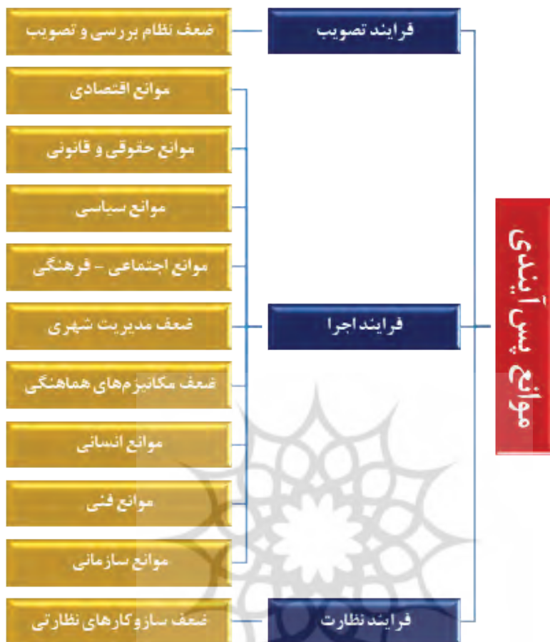
شکل شماره (۵): موانع پیش‌آیندی اجرای طرح جامع راهبردی