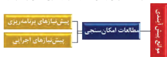
شکل شماره (۳): موانع پیش‌آیندی اجرای طرح جامع راهبردی

نیازسنجی یکی از نخستین مراحل است که در فرآیند برنامه‌ریزی شهری انجام می‌گیرد و فرآیندی است که فاصله و شکاف بین "وضع موجود" و "وضع مطلوب" را شناسایی نموده و سپس اهداف را در قالب نیازها اولویت‌بندی می‌کند. انجام مطالعات امکان‌سنجی شرایطی را برای برنامه‌ریزان فراهم می‌سازد تا در فضای واقعی و به دور از هرگونه آرمان‌گرایی، آینده حاصل از سناریوهای مختلف را از طریق انجام مطالعات عمیق و استفاده از مدل‌سازی‌های پیشرفته و با تکیه بر آمار کمی که دقیق‌ترین نتایج را میسر می‌سازد، پیش‌بینی کرده و پایه برنامه‌ریزی‌ها و پیشنهادات طرح را بر این مطالعات قرار دهند. به عقیده بسیاری از کارشناسان حوزه برنامه‌ریزی شهری، در انجام مطالعات طرح جامع راهبردی تهران، این مطالعات و پیش‌بینی‌ها در خصوص فراهم‌سازی بسترها و پیش‌نیازهای ضروری برای برنامه‌ریزی و اجرای برنامه‌ها صورت گرفته است و در ارائه پیشنهادات طرح تنها به نتایج مطالعات پراکنده مشاوران طرح اکتفا شده که در موارد بسیاری، از انسجام