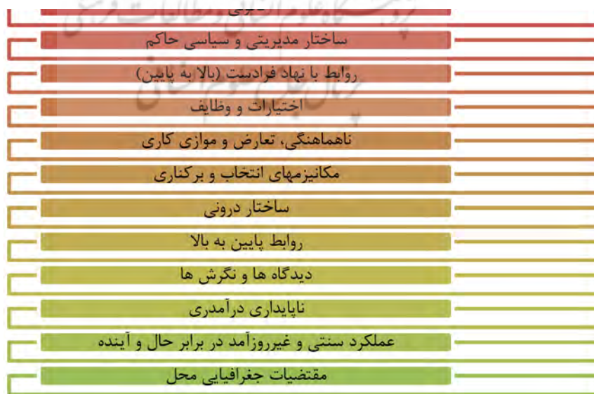
شکل ۱. چالش‌های عمده مترتب بر مدیریت شهری ایران

مدیریت شهری در ایران با چالش‌ها و مشکلات متعددی روبروست. به نظر یکی از پژوهشگران حوزه سیاست‌گذاری مشکل مدیریت یکی از مشکلات تهران است. اگر شهرداری تهران را مدیر شهر تهران بدانیم این سازمان در حال حاضر برای اداره شهر با دو مساله روبرو است. مساله اول نوع تعامل با دولت است. رابطه شهر تهران با دولت بر قاعده‌ای بسامان قرار ندارد. از این رو، شهر در امور خود که به گونه‌ای با دولت مرتبط است دچار دشواری‌هایی می‌شود. مساله دوم نبود مدیریت یکپارچه شهری در سطح کلانشهر تهران است. شهردار تهران بر امور کلانشهر به عنوان یک کلیت تصدی ندارد. باید اشاره کرد که در حال حاضر ۲۶ دستگاه در امر تصمیم‌گیری برای شهر تهران دخالت دارند (وحید، ۱۳۸۷، صص ۲۸۵-