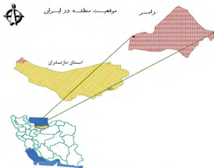
جدول ۱. جاذبه‌های گردشگری شهر رامسر؛ منبع: سجادی، ۱۳۸۴، صص ۲۰۰-۲۵۰