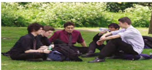
تصویر ۱. وال پارک: دانش‌آموزان در حال استراحت بعد از ناهار

مختلف در طول یک سال به دست آمد با اطلاعات حاصله از پرسشنامه‌ها، مصاحبه‌ها، بازخورد ناظران، با هم ترکیب شده و پکیج کامل اطلاعاتی را در اختیار ما قرار داد. اگر چه ادعا نمی‌شود این داده‌ها تمام حقیقت را در مورد فضاهای عمومی در شهر بیان می‌کند، اما چند روایت مهم که در طول سال جمع‌آوری شده در این پژوهش آورده شده است.