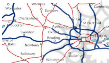
تصویر ۲. مکان آیلسبری در انگلستان.

شهرستان باکینگهام‌شریر به چهار ناحیه تقسیم می‌شود که آیلسبری واله هم جز آنها و مهمترین ناحیه می‌باشد. طبق سرشماری سال ۲۰۰۱ جمعیت آیلسبری واله در کل انگلستان به طور متوسط جوانتر می‌باشد، بدین صورت که در آیلسبری کودکان و نوجوانان زیر ۱۹ سال ۲۶٫۵٪ از جمعیت را تشکیل می‌دهند (انگلیس ۲۵٪)؛ در حالیکه افراد بالای ۶۵ سال فقط ۱۳٪ (در مقایسه با کل انگلیس که ۱۶٪ می‌باشد). ۹۴ درصد جمعیت را سفید پوستان، و بقیه هم از نژاد آسیایی هستند. بین سالهای ۱۹۸۹ تا ۲۰۰۲ جمعیت آیلسبری به ۲۴٪ افزایش یافت که این دو برابر میزان افزایش جمعیت ناحیه جنوب شرقی است که ۱۱٪ بود. در دهه‌های اخیر، امکانات رفت و آمد به لندن در این شهر بسیار بهبود یافته است، از جمله راه آهن، محورهای مواصلاتی خوب، خانه‌های ارزان، مدارس خوب، حومه شهر زیبا و دلفریب، مانند تپه‌های چیلترن. رشد جمعیت نیاز به وجود زیر ساختهای لازم را ایجاد کرده است. برآورد جمعیت برای آیلسبری تا سال ۲۰۰۱، ۶۹۰۰۰ نفر بود، اما با راهکارهای حومه شهری انتظار افزایش تا بیش از ۱۵۰۰۰ سکنه تا سال ۲۰۲۱ می‌رود. ثبات اقتصادی شهر به شکل