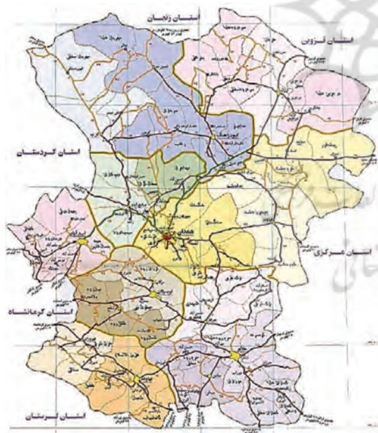
نقشه ۱. نقشه استان همدان برداشت از وبسایت اتحادیه صنف حمل‌ونقل.

استان همدان از لحاظ جمعیت، چهاردهمین و از لحاظ مساحت، بیست و سومین استان کشور محسوب می‌گردد. جمعیت آن بر پایه سرشماری سال ۱۳۹۰ بالغ بر ۱۷۵۸۲۶۸ نفر بوده است. ۵ استان همدان با ۱۹۴۹۳ کیلومتر مربع وسعت، از سمت شمال به استان‌های زنجان و قزوین، از سمت جنوب به استان لرستان، از سمت شرق به استان مرکزی و از سمت غرب به استان‌های کردستان و کرمانشاه محدود شده است. این استان بین مدارهای ۳۳ درجه و ۵۹ دقیقه تا ۳۵ درجه و ۴۸ دقیقه عرض شمالی از خط استوا و ۴۷ درجه و ۳۴ دقیقه تا ۴۹ درجه و ۳۶ دقیقه طول شرقی از نصف‌النهار گرینویچ قرار گرفته و شامل ۹ شهرستان، ۲۵ بخش، ۲۷ شهر، ۷۳ دهستان و ۱۱۲۰ روستا است. ۶ یکی از کلان‌شهرهای ایران در منطقه غربی و کوهستانی ایران و مرکز شهرستان و استان همدان است.