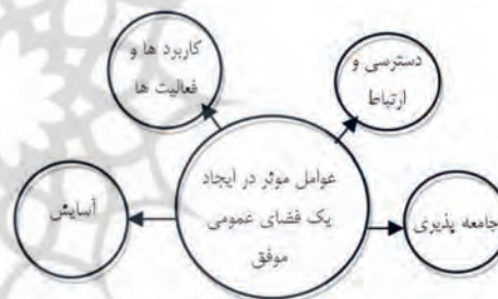
نمودار ۵. فضای شهری موفق برای ارتقا سرمایه اجتماعی؛ ماخذ: Miller, Zahm, Katen, 2010

طراحی، طراحان به طور خلاقانه فضا را بر اساس اینکه مردم چگونه از فضا استفاده خواهند کرد و از فضا چه می‌خواهند، طراحی می‌کنند. به عبارتی باید بدانیم ماهیت فضاهای عمومی چیست. فضای عمومی مکانی است که برای عموم مردم یک جامعه قابل دسترس بوده و به عنوان صحنی که مردم در آن به تبادل لحظات و شادی‌ها و تحولات خود می‌پردازند، مطرح است (Miller, Zahm, Katen, 2010). فضای عمومی هویت و معنا را به شهر می‌دهد و مکانی که هویت داشته باشد برای مردم دعوت کننده خواهد بود (Schwartz, 2005). «استفن کار» در کتاب «فضای عمومی» عنوان می‌کند زندگی اجتماعی در فضاهای عمومی است که معنا پیدا می‌کند و خود را آشکار می‌سازد. کار و دیگران فضای عمومی را به عنوان فضایی باط با قابلیت دسترسی عموم به آن معرفی می‌کنند که افراد به منظور انسجام فعالیت‌های فردی و گروهی به آنجا می‌روند و اظهار می‌دارند که فضای عمومی صحنه‌ای است که بر روی آن نمایش زندگی جمعی در معرض دید قرار دارد (Carr & others, 1992).