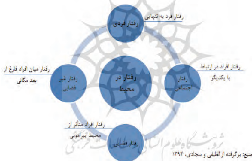
نمودار ۸. انواع رفتار در محیط؛ ماخذ: لطیفی و سجادی، ۱۳۹۴.

خود بدانند در انجام فعالیت های فردی و گروهی در محیط سهیم می شوند و با داشتن تعلق به محیط، مکان و سهم آنان از محیط به آرامش خاطر می رسند. با رسیدن به حس امنیت در جامعه با افراد و گروه های دیگر به تعامل رسیده و در آن محیط اقدام به کسب مهارت و انجام فعالیت های اجتماعی می نمایند و در نهایت حس اعتماد به نفس در آنان افزایش می یابد (حبیب و همکاران، ۱۳۹۰، ص ۸۱). در نمودار ذیل چرخه مولفه های دخیل در فعالیت های اجتماعی در پارک های