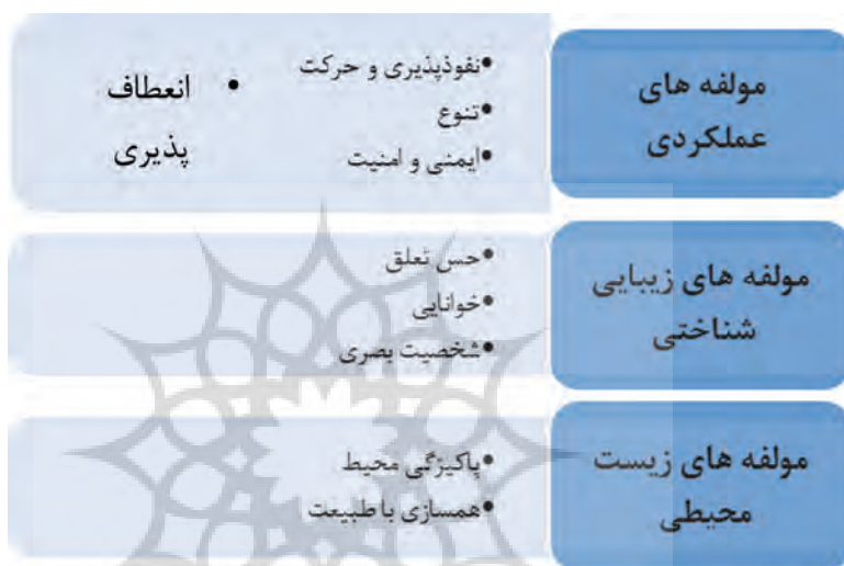
نمودار ۴. مؤلفه های اثرگذار در موفقیت پارک های شهری