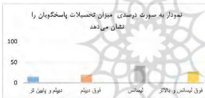
نمودار ۳. توزیع فراوانی تحصیلات؛ ماخذ: یافته‌های تحقیق.