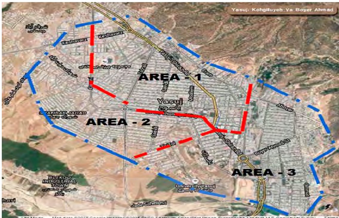
تصویر ۱. نقشه منطقه بندی شهر یاسوج