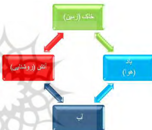
جدول ۲. عناصر چهار گانه؛ ماخذ: دهخدا، ۱۳۷۷.

جامعه آماری به صورت همگن بوده- اند و نمونه مورد پژوهش شهروندان شهر یاسوج می- باشد. روش نمونه گیری بصورت نمونه گیری تصادفی بوده و در بهار سال ۵۹۳۱ پر شده است، پژوهش حاضر توصیفی از نوع پیمایشی می باشد. متغیر مستقل، منظر شهری و متغیر وابسته، هویت مکان می باشد. تعداد کل پرسشها ۲۳ سؤال بوده است که به صورت بسته طراحی شده است و پرسشنامه بر اساس مقیاس لیکرت (کاملاً مخالفم، ۱؛ مخالفم، ۲؛ نه موافقم نه مخالف، ۳؛ موافقم، ۴؛ کاملاً موافقم، ۵) می- باشد که اعتبار ابزار سنجش تحقیق از طریق اعتبار محتوایی، اعتبار صوری با مراجعه به اساتید و دریافت اتفاق نظر آنان در مورد شاخصها بدست آمده است. همچنین در زمینه پایایی پرسشنامه از گویه- های ابزار سنجش از طریق همبستگی گویه به گویه پایایی کل ابزار سنجش ارزیابی شد. آماره آلفا کرونباخ که دامنه آن از صفر تا یک است شاخص پایایی گویه- های ابزار سنجش می باشد که در این تحقیق با نسبت بالا (۰/۴۰۹) تأیید شده است. حجم نمونه بر اساس فرمول کوکران در جدول دموگرافان ۴۸۳ نفر بدست آمده است. پرسشنامه ها و به روش خوشه- ای تصادفی به وسیله پرسشگر بین شهروندان توزیع گردیده است. برای تجزیه و تحلیل از نرم افزار spss ۲۲ استفاده شده است و نتایج در دو سطح آمار توصیفی و استنباطی مورد بررسی قرار گرفته است. تحقیق از نوع همبستگی است. در آمار استنباطی از آزمون ضریب همبستگی پیرسون و رگرسیون خطی برای بررسی فرضیات تحقیق استفاده شده است.