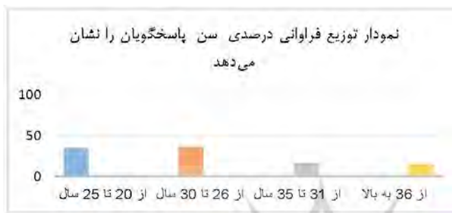
نمودار ۲. توزیع فراوانی سن؛ ماخذ: یافته‌های تحقیق.