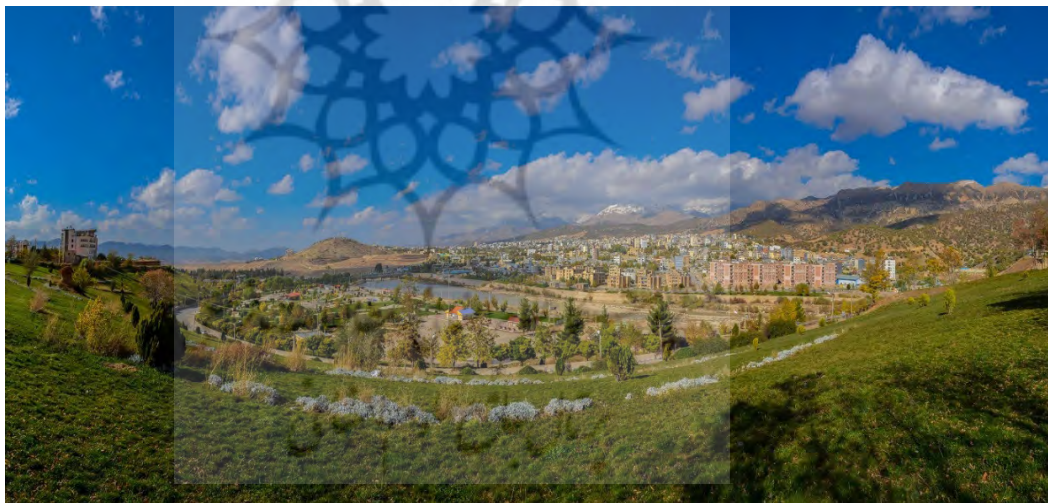
تصویر ۲. دورنمای شهر یاسوج نمای جنوبی