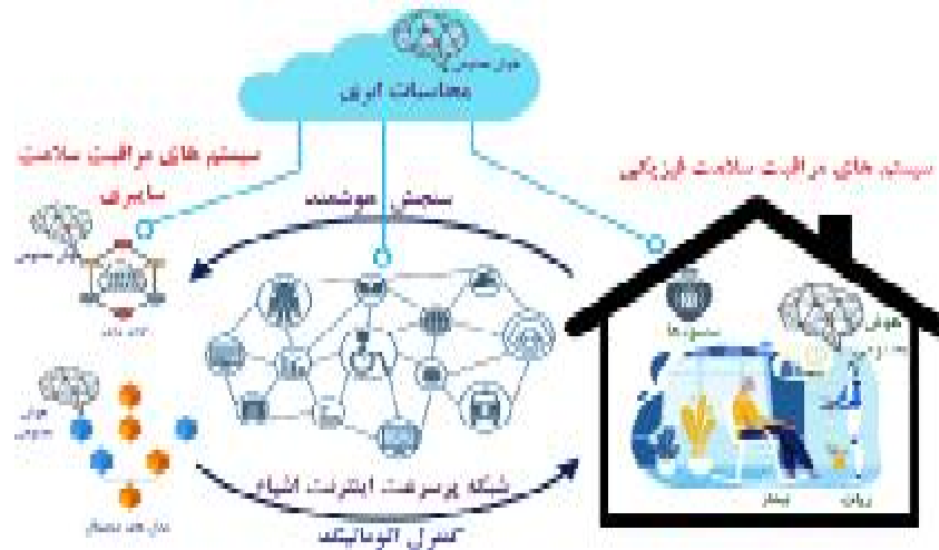
شکل 2. نمونه‌ای از مراقبت بهداشتی 4/0