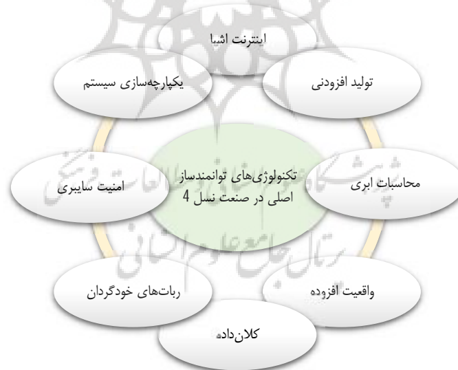
شکل 1. تکنولوژی‌های توانمندساز صنعت 4/0

رشد صنعتی در سراسر جهان با نخستین انقلاب صنعتی در قرن 18 آغاز شد. صنایع به‌طور کلی به‌عنوان اولیه، 17 ثانویه، 18 سوم و 19 چهارم 20 طبقه‌بندی می‌شوند. صنعت نسل 4 که در قرن بیست‌ویکم شروع شده، دوره جدیدی در مسابقات فناوری کشورها است (کاراتاس و همکاران، 2022) که تکنولوژی‌های مختلفی در آن استفاده می‌شود. تکنولوژی‌های توانمندساز این صنعت در شکل 1 نشان داده شده است.