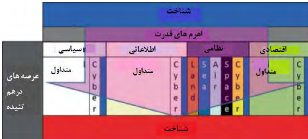
شکل ۱. شناخت به‌عنوان عرصه کلیدی

در بخش‌های قبلی ذکر شد، جنگ‌شناختی حوزه‌ای بسیار پیچیده و تخصصی است و همان‌گونه که اجرای مأموریت در عرصه‌های متعارف جنگ به سازمان، منابع انسانی، امکانات، زیرساخت‌ها، فناوری‌ها، اسناد و آیین‌نامه‌ها و مقررات و قوانین پشتیبانی نیازمند است، اجرای مأموریت در عرصه جنگ‌شناختی هم این استلزامات را می‌طلبد. همان‌طور که در شکل ۱ نشان داده شده است، شناخت هم به‌عنوان یک عرصه مستقل بالادستی، بر سایر عرصه‌ها و اهرم‌های قدرت تأثیر می‌گذارد و هم، به‌عنوان نتیجه سایر عرصه‌ها در نظر گرفته شود (هیلسون ۱ ، ۲۰۰۹).