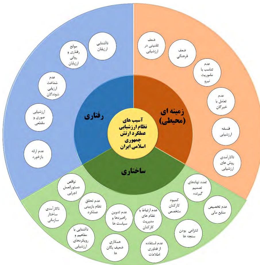
شکل ۱. مدل اولیه به‌دست‌آمده از بخش کیفی (تحلیل مضامین)

مطابق شکل ۱ آسیب‌های نظام ارزشیابی عملکرد ارتش جمهوری اسلامی ایران را می‌توان در قالب سه عامل ساختاری، رفتاری و زمینه‌ای دسته‌بندی کرد. عوامل ساختاری مشتمل بر ۱۲ آسیب، عوامل رفتاری ۵ آسیب و عوامل زمینه‌ای (محیطی) ۶ آسیب است.