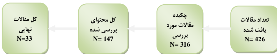
شکل ۱. نتایج جستجو و انتخاب مقاله‌ها

ملاک ورود به متون مناسب، شامل پژوهش‌های چاپ شده مرتبط با مدیریت استعداد بود که اطلاعات کافی را در مورد تحقیق گزارش کرده باشند. ملاک خروج متون نیز هر گونه منبع علمی بی ارتباط با سؤال تحقیق بود. در نهایت، ۲۰۶ مقاله گردآوری شد. با مطالعه عنوان تحقیق، چکیده و محتوای مقاله‌ها مواردی که با موضوع و سؤال تحقیق تناسب نداشتند، حذف شدند. در غربال‌گری مقاله‌ها از ابزار برنامه مهارت‌های ارزیابی حیاتی و نظرسنجی از خبرگان تحقیق استفاده شد، این برنامه شامل ۱۰ سؤال است که این موارد را برای هر مقاله ارزیابی می‌کند: هدف پژوهش، منطق روش، طرح پژوهش، روش نمونه‌گیری، جمع‌آوری داده‌ها، انعکاس‌پذیری، ملاحظات اخلاقی، دقت تجزیه و تحلیل داده‌ها، بیان واضح یافته‌ها و ارزش پژوهش. همان‌طور که در شکل ۱ ملاحظه می‌شود در نهایت ۳۳ مقاله مرتبط با موضوع گردآوری شد.