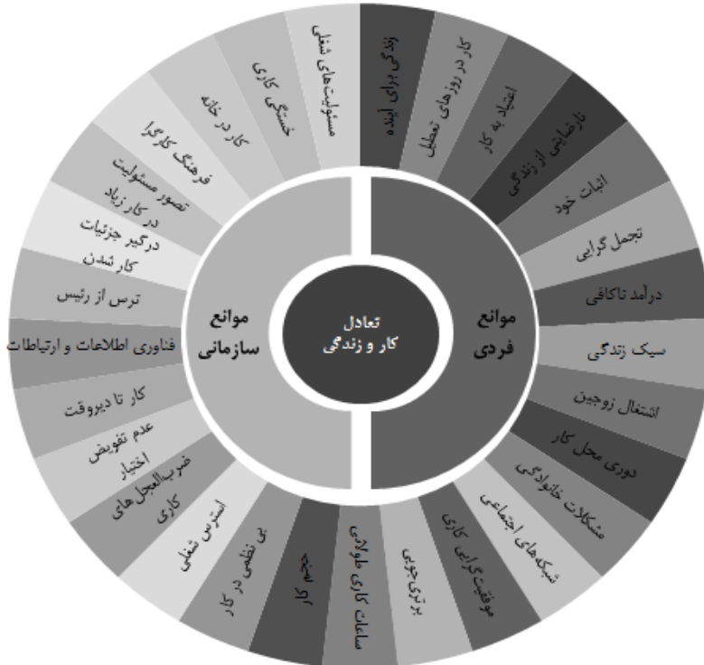
شکل ۴. موانع فردی و سازمانی تعادل کار و زندگی

برای بررسی فرضیه‌ها از آزمون همبستگی و تحلیل مسیر استفاده شد. نتایج حاصل از آزمون همبستگی نشان می‌دهد که حمایت کاری و خانوادگی، انعطاف‌پذیری کاری و منابع فردی، هر سه با غنی‌سازی کار-خانواده رابطه مثبت و معنادار دارند. همچنین حمایت کاری و خانوادگی و منابع فردی رابطه ای منفی و معنادار با تعارض کار خانواده دارند؛ اما انعطاف‌پذیری کاری رابطه معناداری با این متغیر ندارد. تعارض کار-خانواده رابطه منفی و معناداری با غنی‌سازی کاری و توازن کار-خانواده دارد. غنی‌سازی کار-خانواده رابطه مثبت و معناداری با توازن کار خانواده دارد. این موانع در شکل ۴ نشان داده شده‌اند. این یافته‌ها با نتایج پژوهش‌های پیشین در خصوص موانع ایجاد و حفظ تعادل کار و زندگی سازگار است از جمله رحمان و رومی (۲۰۱۲)، والر و راگسدل، (۲۰۱۲)، شیانگ و همکاران (۲۰۱۰)، پوکایادون (۲۰۱۵) و اسدی و همکاران (۱۳۸۹).