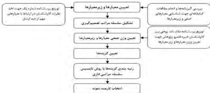
شکل ۲- مراحل اجرای پژوهش انتخاب کارشناس نمونه بر اساس مدل تاپسیس سلسله مراتبی در محیط فازی

با بررسی آیین‌نامه استخدامی اعضای غیر هیأت علمی دانشگاه‌ها، آیین‌نامه انتخاب کارمند نمونه (جشنواره شهید رجایی)، آیین‌نامه اجرایی انتخاب کارمند نمونه در سایر دستگاه‌های اجرایی نظیر وزارت نیرو، شهرداری تهران، دانشگاه‌های علوم پزشکی و ... و منابع کتابخانه‌ای بیش از ۴۰ معیار مختلف شناسایی شدند. پس از تلخیص و دسته‌بندی معیارهایی که از منابع مختلف استخراج شده بود، فهرست معیارها در اختیار کارشناسان دانشگاه قرار گرفت و از آن‌ها خواسته شد تا معیارهایی را که در ارزیابی و انتخاب کارمند نمونه مؤثرند، مشخص کنند. پس از جمع‌بندی، ۳ معیار اصلی شامل ۱۳ معیار فرعی که کارشناسان درباره آن‌ها اتفاق نظر بیشتری داشتند، انتخاب و سپس، این معیارها با توجه به نظر کارشناسان دانشگاه در قالب معیار رفتار سازمانی، معیارهای رفتار فردی و معیار آموزش و پژوهش طبقه‌بندی شدند. همچنین معیارهای فرعی و مصادیق آن‌ها در قالب ۱۳ زیر معیار دسته‌بندی شدند.