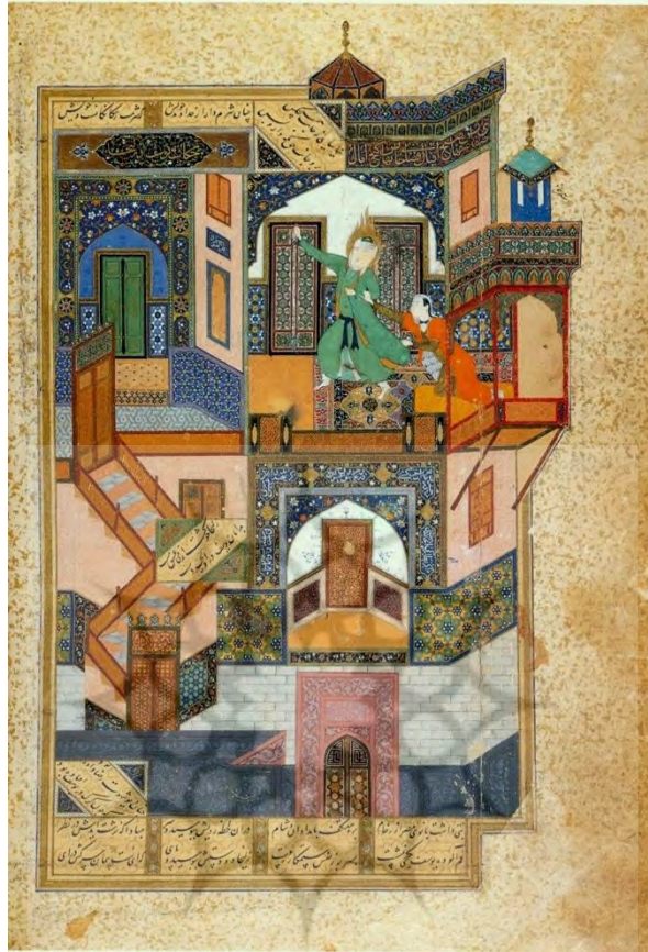
تصویر شماره ۱: نگاره حکایت یوسف و زلیخا، اثر کمال‌الدین بهزاد، منبع: موزه قاهره.

رو قابل توجه است که در کنار آثار ذکر شده، در این دوران نسخه‌ای از بوستان سعدی نیز در بستر سنت اندرزدهی سیاسی در کتابخانه سلطنتی بازتولید شده است. از صفحات بجامانده از این نسخه، نگاره‌ای از کمال‌الدین بهزاد، با موضوع یوسف و زلیخا و با در بر داشتن اشعاری از جامی و سعدی، به شکل ویژه‌ای این حکایت را تجسم بخشیده است. به نظر می‌رسد شکل‌گیری این نگاره نیز در نسبت با بحران زمانه بوده و در بستر سنت اندرزدهی سیاسی بروز یافته است.