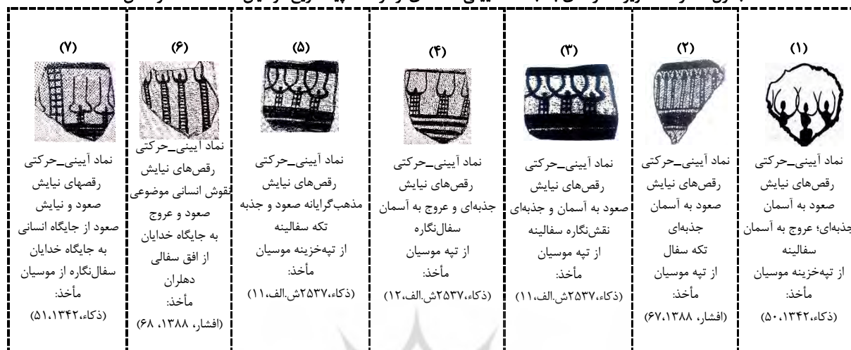
جدول شماره ۲: تصویر-نگاره‌های به جامانده آیینی-اعتقادی از فرهنگ پیشاتاریخ موسیان

روش کیفی و شیوه توصیفی-تحلیلی سعی خواهد کرد تا به معانی، پیام و موضوعیت پنهان نگاره‌های فرهنگ پیشاتاریخی موسیان دست یازد. به واسطه این تحلیل، هم بخشی از هنر پیشاتاریخی ایران مطالعه می‌شود و هم شناخت نسبی از فرهنگ موسیان پیش از تاریخ ایجاد می‌شود. در انتهای مقاله انتظار نگارندگان این بوده که این نگاره‌ها را بتوان در یک عنوان مناسب نام‌گذاری کرد: "نگاره‌های آیینی-اعتقادی فرهنگ پیشاتاریخ موسیان".