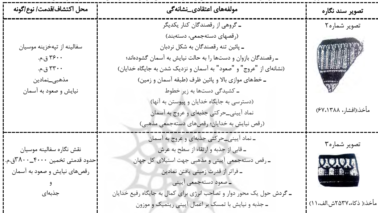
جدول ۵: نمادهای تصویرسازی شده نگاره‌های نیایش و صعود به آسمان در فرهنگ موسیان تنظیم نگارندگان

با تداوم اتخاذ شیوه متکی بر خاستگاه‌یابی ارجاعی اعتقادی-فرهنگی، عناصر تصویری باورمدارانه و نمادین بیشتری در نگاره‌های موسوم شده به نگاره‌های نیایش و صعود به آسمان موسیان، آشکار و رمزگشایی خواهد شد (تصاویر ۲ و ۳ جدول ۵). کاربرد این شیوه، تحلیل مناسبی را از عناصر تصویری و تجریدی پیکره‌های رقصندگان، اندام‌های پیکره‌ها، تنه و نیم‌تنه‌های نردبانی شکل نگاره‌ها بدست می‌دهد. در جای مناسب و در تحلیل نگاره‌های دیگر، مقاله از این فرآیند بیشتر بهره خواهد برد.