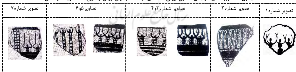
جدول ۳: تصاویر سفال‌نگاره‌های نمادین آیینی-اعتقادی فرهنگ موسیان، پیش از تاریخ تنظیم: نگارندگان

به‌طور کلی، عناصر نمادین نگاره‌های این آثار به قرار ذیل قابل تمیز و تبیین موردی خواهد بود: