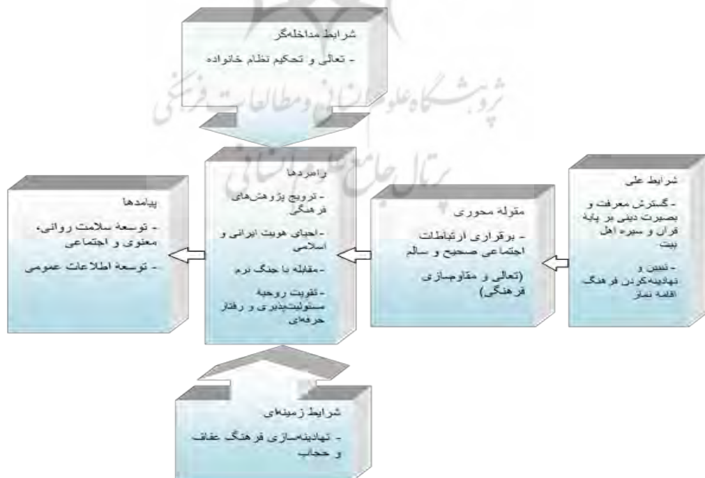
شکل ۱- مدل پارادایمی نقشه راه تعالی و مقاومت‌سازی فضای فرهنگی براساس سیاست‌های کلی نظام؛ ابلاغی از سوی مقام معظم رهبری (مُدْظَلَّةُ الْعَالِي)

درنهایت و در مرحله رمزگذاری انتخابی با توجه به نتایج گام‌های قبلی رمزگذاری، مقوله اصلی انتخاب و به‌شکلی نظام‌مند به سایر مقوله‌ها مرتبط شد. به‌عنوان مثال، یکی از رمزهای اولیه که بعد از اتمام مصاحبه و جمع‌آوری داده‌ها حاصل شد "توسعه و ترویج فرهنگ مطالعه و کتابخوانی" بود که با توجه به مبانی و مفاهیم مشترکی که با چند شاخص دیگر داشتند در یک مقوله محوری تحت عنوان "توسعه اطلاعات عمومی" دسته‌بندی شدند و این مقوله نیز با توجه به مقوله‌های مرکزی جزو مقولات