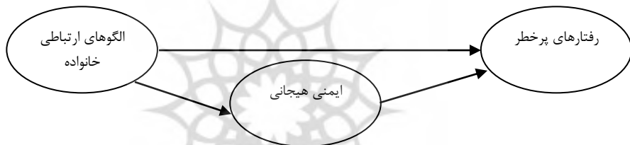
شکل ۱: مدل فرضی بین متغیرهای موردبررسی

ارتباط و اثر دوسویه سلامت روان والدین، تعاملات والدینی، و سبک فرزندپروری با میزان ایمنی هیجانی در پژوهش شودلیچ و همکاران (۲۰۱۹) بررسی شده است. یافته‌ها نشان داد که افسردگی پدران به‌طور قابل توجهی با هر نوع تعارض بین والدینی مرتبط است. علائم افسردگی مادر تنها با تعارض افسردگی همراه بود. والدین سازنده با فرزندپروری حساس‌تر و جدایی کمتر برای هر دو والد همراه بود. تعارض مخرب به‌طور منفی با میزان حساسیت پدران مرتبط بود. جدایی مادری و پدری با نایمنی هیجانی فرزند همراه بود؛ همان‌طور که حساسیت پدری نیز وجود داشت، اما ارتباطات معنادار کمتری برای مادران یافت شد. با توجه به نتایج پژوهش‌های فوق، می‌توان گفت که عوامل گوناگون فردی، خانوادگی و اجتماعی می‌تواند در بروز و تداوم انواع رفتارهای مناسب و نامناسب نوجوانان تأثیرگذار باشد. بنابراین در پژوهش حاضر در پی پاسخ‌گویی به این مسئله هستیم که آیا ایمنی هیجانی می‌تواند میانجی بین الگوهای ارتباطی خانواده و رفتارهای پرخطر در نوجوانان باشد یا خیر؟