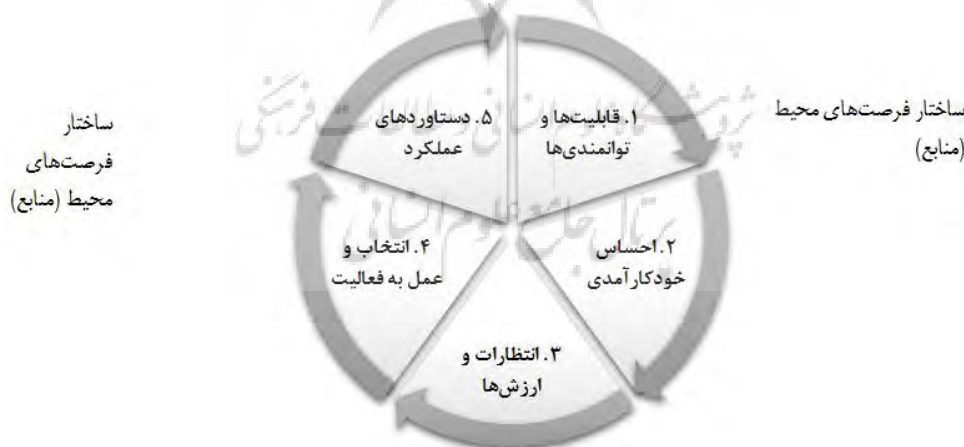
شکل ۱. فرایند توانمندسازی

مرور مدل‌های توانمندسازی وجود اشتراکاتی در این مدل‌ها را نشان می‌دهد. مدل زیر از تلفیق عناصر توانمندی موجود در تعاریف مختلف و با توجه به مدل لورین بیت ۲ ایجاد شده است. بیت (۲۰۱۰) با اتکا به تئوری سن سعی کرده است آن را به صورت فرایند عملیاتی کند. این پژوهش با جایگذاری راهبردهای عملیاتی نهادهای حمایتی در مدل فرایندی یک برنامه عملی توانمندسازی را توسعه می‌دهد.