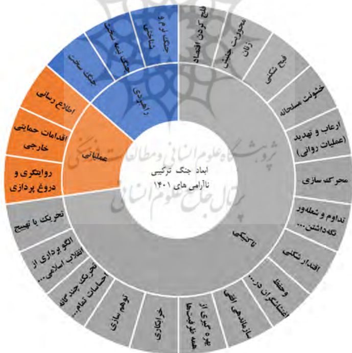
شکل ۱- ابعاد و مؤلفه‌های جنگ ترکیبی ناشی از ناآرامی‌های ۱۴۰۱