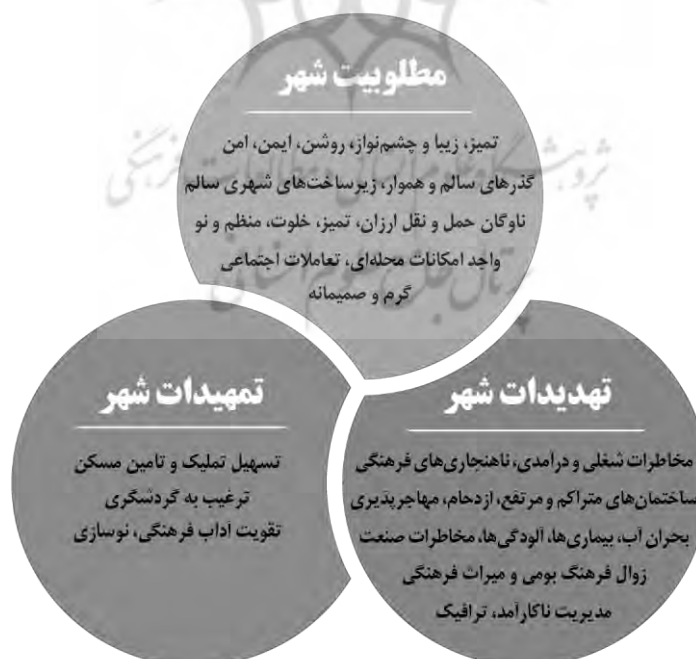
شکل ۳- شبکه مضامین کیفیت زندگی شهری در اصفهان

همان‌گونه که ذکر شد، دغدغه‌های بیان‌شده درباره کیفیت زندگی شهری در اصفهان با استفاده از تکنیک تحلیل مضمون تحلیل شد و در نهایت مشخص شد که شهروندان شرکت‌کننده