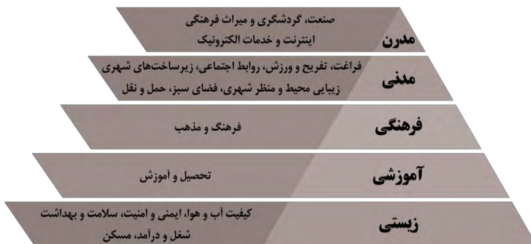
شکل ۲- هرم خوشه‌بندی اولویت‌های ابعاد کیفیت زندگی شهری