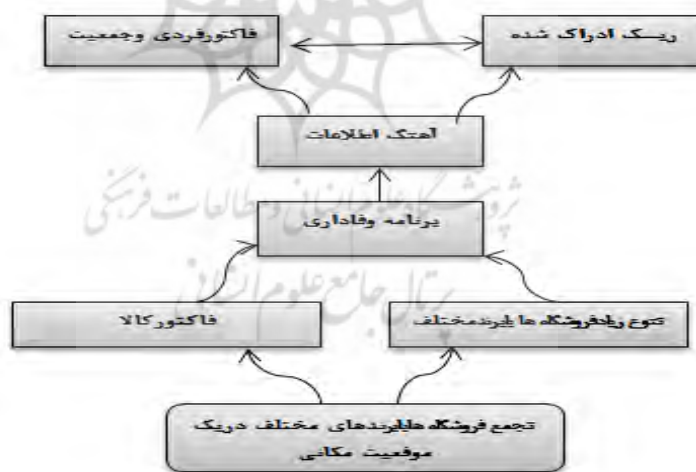
شکل ۱- مدل ساختاری تفسیری پژوهش (منبع یافته‌های پژوهشگر)

مدل نهایی حاصله، از پنج سطح تشکیل می‌شود. عواملی که در سطوح بالای سلسله‌مراتب قرار دارند، از تأثیرگذاری کمتر و تأثیرپذیری بیشتری برخوردارند. عامل‌های ریسک ادراک‌شده و فاکتور فردی و جمعیت در ارتباط با موضوع پژوهش و ارائه مدل سردرگمی مشتریان از اثرپذیری بیشتری برخوردار بوده و در مقابل عامل تجمع فروشگاه‌ها با برندهای مختلف بیشترین تأثیرگذاری را در مدل حاضر دارا هستند.