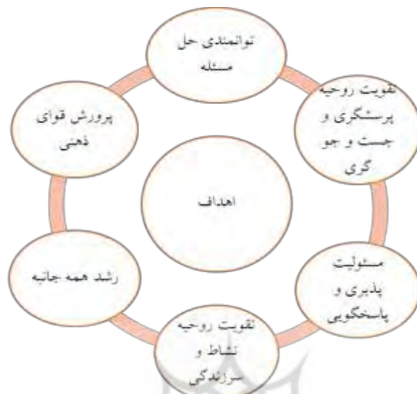
شکل ۱: الگوی اهداف برنامه درسی مسئله محور در دوره پیش دبستانی

حلیمه میرعرب رضی ❖ حسین فکوری حاجیار ❖ کاظم شریعت نیا ❖ علی اصغر بیانی