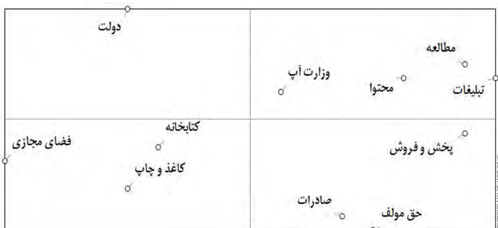
نمودار ۱- نمودار ادراکی متغیرهای کلیدی آینده کتاب در ایران به روش میک‌مک

سیستم در نظر گرفته می‌شوند. در بین این متغیرها، اغلب متغیرهای محیطی ۹ هستند که به شدت سیستم را مشروط می‌کنند اما عموماً نمی‌توانند توسط سیستم کنترل شوند. متغیرهای محیطی بیشتر به عنوان عامل اینرسی عمل می‌کنند.