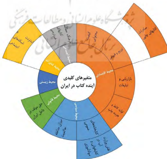
شکل ۱- مدل نهایی متغیرهای کلیدی آینده کتاب ایران براساس مدل پستل و رویکرد لایه‌ای