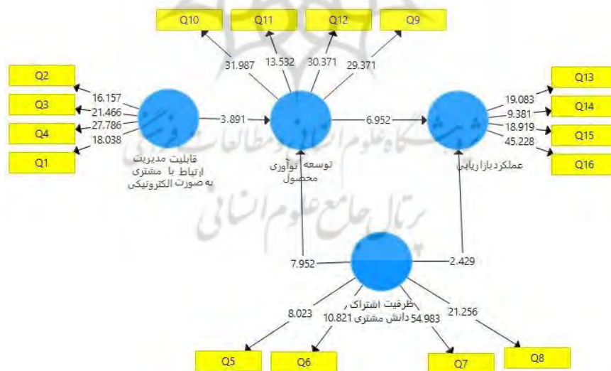
شکل ۲. معناداری ضرایب مسیر (آماره تی)

در این پژوهش برای سنجش عملکرد کلی مدل، معیار GOF مد نظر قرار گرفت. (Mohsenin & Esfidani, 2016). به منظور محاسبه GOF باید از متوسط حسابی مقادیر اشتراکی و ضرایب تعیین میانگین هندسی گرفته می شود. اعداد ۰/۱، ۰/۲۵ و ۰/۳۶ به منزله ضعیف، متوسط و قوی بودن شاخص GOF مدنظر قرار می گیرد (Davari & Rezazadeh, 2013). بنابراین GOF، در بازه قوی قرار داشته و مدل، برازش کلی مطلوبی دارد. برای سنجش مدل ساختاری و آزمون فرضیات، ابتدا آزمون معناداری تی مورد استفاده قرار گرفته و با توجه به درصد خطای ۰/۰۵ در نظر گرفته شد تا معناداری اثرگذاری سنجیده شود. در این مرحله چنانچه قدرمطلق مقدار آماره تی بالاتر از ۱/۹۶ باشد نشان دهنده معنادار بودن اثرگذاری مورد سنجش است، در غیر صورت اثرگذاری معنادار در نظر گرفته نمی شود (Mohsenin & Esfidani, 2016). همان طور که مشاهده می شود شکل ۲ مقادیر آماره تی را نشان داده است که مبنای رد یا تأیید فرضیه ها بر این اساس در سطح اطمینان ۹۵ درصد صورت خواهد پذیرفت.