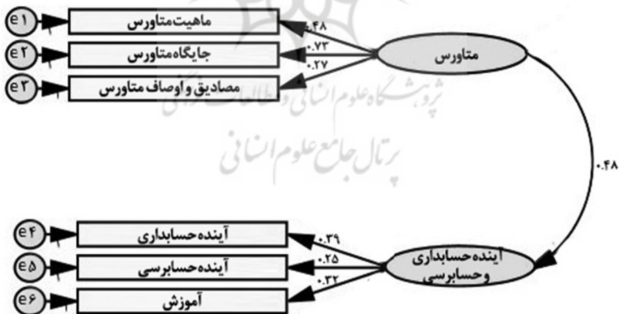
شکل ۲. مدل اندازه‌گیری

مدل اندازه‌گیری پس از اصلاحات نیز به شکل ذیل است: