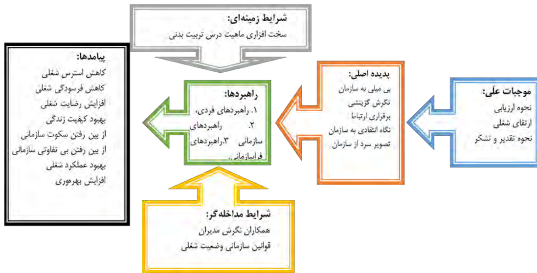
شکل ۱. مدل نهایی بی حسی سازمانی در بین معلمان ورزش

می‌پردازد. با توجه به روش فورنل و لارکر که مقدار مناسب برای AVE را ۰/۴ به بالا معرفی کرده‌اند. برای تمامی ۶ متغیر، مقدار AVE بیشتر یا مساوی ۰/۴ می‌باشد. روایی واگرا سومین معیار بررسی برازش مدل‌های اندازه‌گیری است که در این پژوهش در هر دو بخش روش اول (سؤالات مربوط به هرمتغیر نسبت به خود آن متغیر همبستگی بیشتری دارند تا نسبت به متغیرهای دیگر) و دوم (معیار مهم دیگری که با روایی واگرا مشخص می‌گردد، میزان رابطه یک متغیر با سؤالاتش در مقایسه رابطه آن متغیر با سایر متغیرهاست)، به‌طوری‌که روایی واگرای قابل‌قبول یک مدل حاکی از آن است که یک متغیر در مدل تعامل بیشتری با سؤالات خوددار تا با متغیرهای دیگر. روایی واگرا وقتی در سطح قابل‌قبول است که میزان AVE برای هر متغیر بیشتر از واریانس اشتراکی بین آن متغیر و متغیرهای دیگر در مدل باشد، مورد تأیید قرار گرفت. بعد از بررسی برازش مدل‌های اندازه‌گیری نوبت به برازش مدل ساختاری پژوهش می‌رسد. همان‌گونه که قبلاً اشاره شد، بخش مدل ساختاری برخلاف مدل‌های اندازه‌گیری، به سؤالات (متغیرهای آشکار) کاری ندارد و تنها متغیرهای پنهان همراه با روابط میان آن‌ها بررسی می‌گردد.