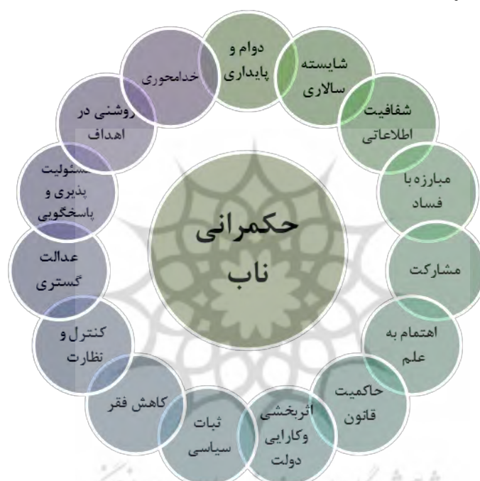
شکل ۲: ابعاد حکمرانی ناب

بتوانند سالم، بهره ور و با لذت زندگی کنند. دوام و پایداری جامعه، موجب سازگاری بین دولت و ملت می شود و با توازن بخشی به قدرت دولت، موجب امنیت اقتصادی و اجتماعی و کاهش تنش در جامعه می گردد (طاهری و دیگران، ۱۳۹۲).