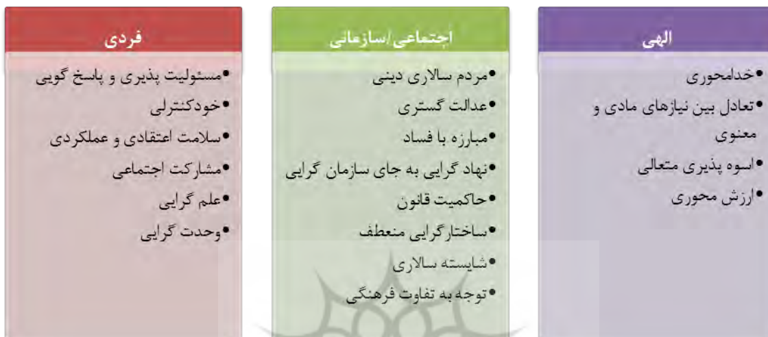
شکل ۴: ابعاد حکمرانی ناب