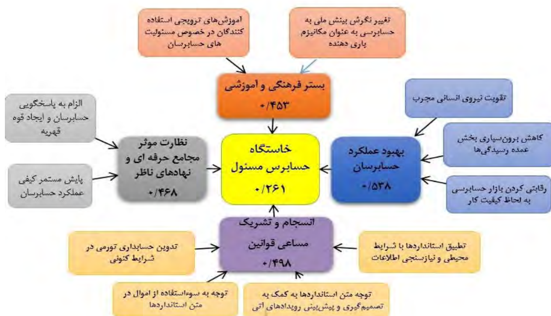
شکل ۲. الگوی مفهومی و ساختاری خاستگاه حسابرس مسئول در ایران