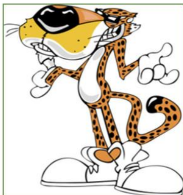
تصویر ۸ مسکات Chester Cheetah برند چیتوز شرکت فرینولی