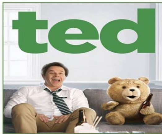
تصویر ۶ شخصیت کارتونی تد