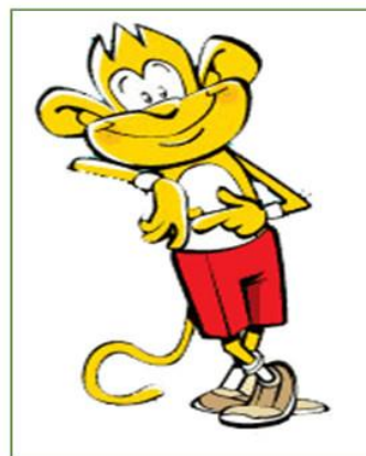
تصویر ۴ مسکات میمون برند چیتوز شرکت دینا

باتوجه به اینکه این برند ایرانی است و در رسانه‌ها تبلیغات گسترده‌ای داشته است، مسکات را همه مشارکت‌کنندگان می‌شناختند. جدول زیر نشان‌دهنده این است که اگر مشارکت‌کنندگان این برند را نمی‌شناختند، حدس می‌زدند که برای کدام گروه کالایی است و همچنین نظرات مشارکت‌کنندگان برای مسکات پیشنهادی چیست.