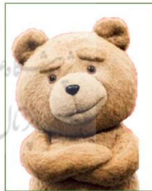
تصویر ۵ مسکات خرس فعلی ایران رادیاتور

برند ایران رادیاتور گرچه برند ایرانی است ولی ۸ نفر از ۱۱ نفر آن را شناسایی کردند. جدول زیر نشان‌دهندهٔ حدس و تشخیص مشارکت‌کنندگان از گروه کالایی این مسکات و فراوانی مسکات پیشنهادی برای برند ایران رادیاتور است. در این مسکات، حدود ۳۲ درصد نظرشان روی حیوانات قطبی بوده است،