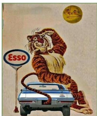
تصویر ۶ مسکات شرکت اکسون موبیل