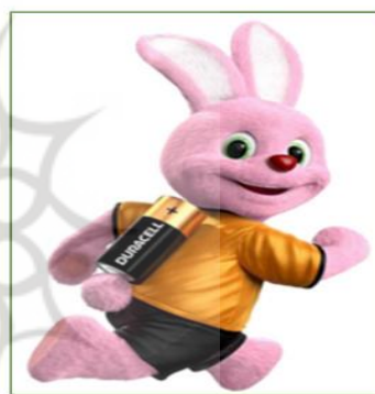
تصویر ۲ مسکات خرگوش، برند دوراسل

از میان ۱۳ نفر مشارکت‌کننده برای مصاحبه خرگوش دوراسل، ۶ نفر شناختند و ۲ نفر توانستند ارتباطی بین مسکات و گروه کالایی باتری را پیدا کنند. نتایج جدول زیر تشخیص گروه کالایی برای مسکات موردنظر و نظرات مشارکت‌کنندگان برای طراحی مسکات جدید برای محصول باتری را نشان می‌دهد.