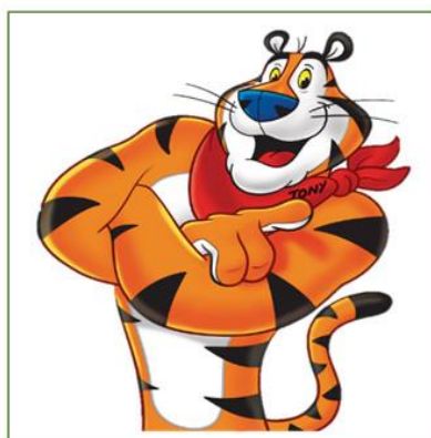
تصویر ۳ مسکات ببر تونی، متعلق به برند کلاگ

از میان ۱۳ نفر مشارکت‌کننده تنها ۱ نفر نام برند را ذکر کرد و ۳ نفر محصول را متوجه شدند. جدول زیر نتایج تشخیص گروه کالایی مسکات و مسکات پیشنهادی برای برند کلاگ را نشان می‌دهد.