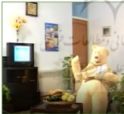
تصویر ۱۰ مسکات خرس ابتدایی ایران رادیاتور

ایران رادیاتور نام شرکتی ایرانی است که در سال ۱۳۵۸ در زمینه تولید رادیاتور و سیستم‌های گرمایشی ساختمان شروع به کار کرد. این شرکت در سال ۱۳۶۹ مسکات خود را با نام عمومی‌ادگار در تبلیغات تلویزیونی معرفی نمود و پس از وقفه‌ای چندساله دوباره با شخصیت جدیدی در سال ۱۳۹۳ مسکات خود را احیا نمود. شعار شرکت "با ما دل‌گرم باشید" است و شعار مسکات "پشتم گرمه" است. این مسکات یک خرس قهوه‌ای‌رنگ کوچک است. تصویر مسکات ابتدایی و مسکات جدید به شرح زیر است.