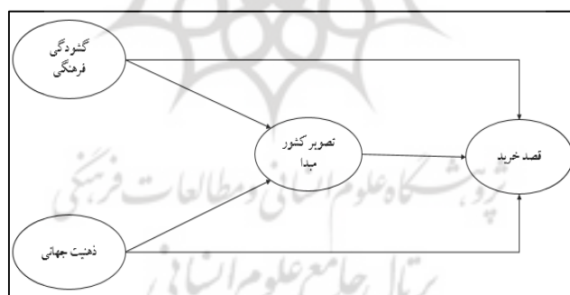
شکل (۱) مدل مفهومی پژوهش اقتباس از پژوهش لی و راب (۲۰۲۲)

جهان‌بینی مصرف‌کنندگان و نگرشی که به جهان دارند در تصمیمات آنان نقش دارد. به طوریکه، ذهنیت جهانی مصرف‌کنندگان بر تصویر کشور مبدا تاثیر دارد. لی و راب (۲۰۲۲) ذهنیت جهانی بر تصویر کشور محصول تولید شده در میان مصرف‌کنندگان جایگاه ویژه‌ای دارد. از طرفی، ذهنیت جهانی و نگرشی که مصرف‌کنندگان به جهان دارند بر قصد خرید مصرف‌کنندگان تاثیر معناداری دارد. چاکرابورتی و ساداچار ۱ (۲۰۲۰) ذهنیت جهانی را به عنوان عوامل اثرگذار بر قصد خرید معرفی کرده‌اند و اظهار داشتند ذهنیت جهانی و تلاش برای انطباق با جهان منجر به قصد خرید مصرف‌کنندگان می‌شود. بااین حال، گشودگی فرهنگی بر تصویر کشور مبدا تاثیر دارد. لی و راب (۲۰۲۱) در پژوهش دیگری بیان داشتند گشودگی فرهنگی بر تصویر کشور مبدا در میان مصرف‌کنندگان تاثیر دارد. درواقع، مصرف‌کنندگان با مشاهده فرهنگ برند تصویری خاص از یک کشور تجسم می‌کنند که در نگرش آنان نقش دارد. به طوریکه، وجود فرهنگ موثر و ارزشمند در یک کشور در تصمیمات خرید و قصد خرید مصرف‌کنندگان نقش دارد. در همین چارچوب ارکایا ۲ (۲۰۱۹) عواملی مانند قوم‌گرایی مصرف‌کننده، ذهنیت جهانی، وطن‌پرستی، جمع‌گرایی، گشودگی فرهنگی را در رفتار خرید مصرف‌کنندگان موثر دانسته‌اند. علاوه براین، وجود تصویر کشور مبدا و جایگاهی که میان مصرف‌کنندگان دارد در قصد خرید مصرف‌کنندگان موثر است. چرا که، محمود ۳ و همکاران (۲۰۲۱) تصویر کشور مبدا را در قصد خرید مصرف‌کنندگان موثر دانسته‌اند. ابراهیمی (۱۳۹۹) در تحقیق خود اثبات کردند که تصویر کشور مبدا بر قصد خرید اثر مستقیم و معنی‌داری دارد.