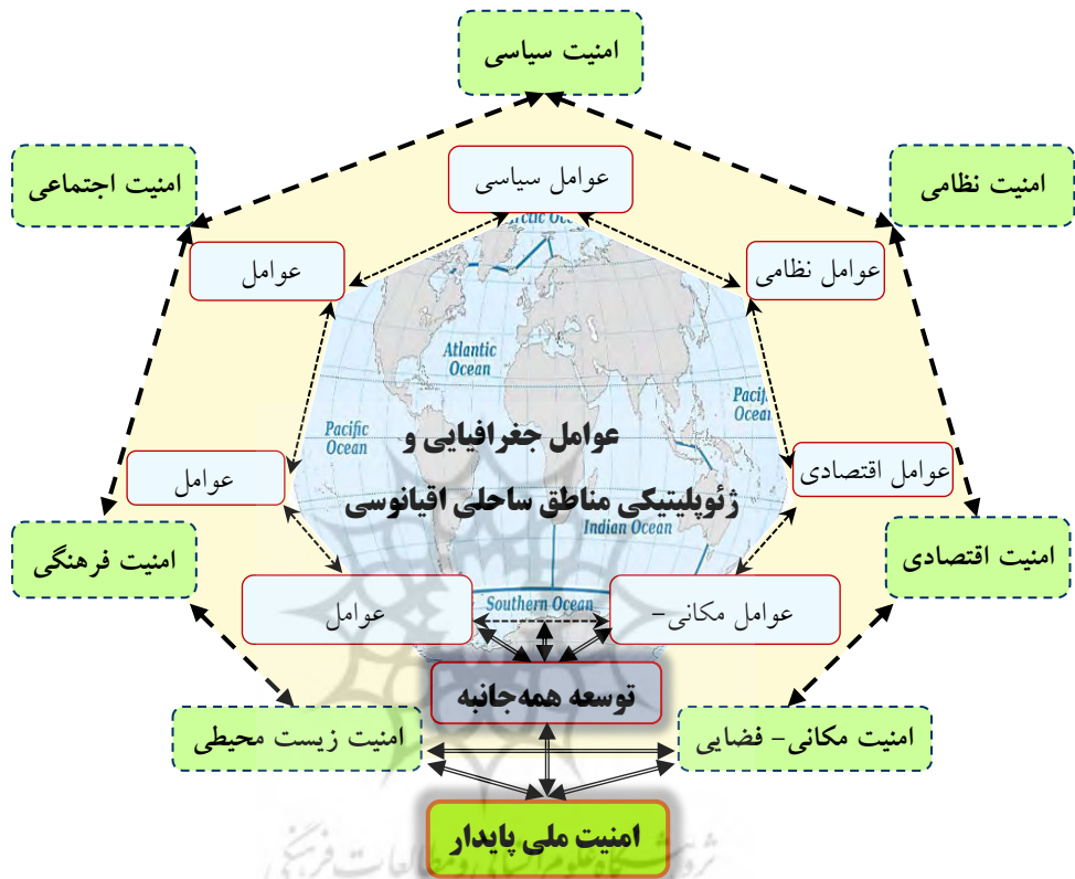
شکل (۱) رابطه عوامل جغرافیایی و ژئوپلیتیکی مناطق ساحلی اقیانوسی و امنیت ملی

این تحقیق را میتوان در زمره تحقیقات بنیادی و کاربردی لحاظ نمود. روش تحقیق در این مقاله توصیفی-تحلیلی است. روش گردآوری داده‌ها در این تحقیق، به هر دو روش کتابخانه‌ای و میدانی است. در روش کتابخانه‌ای از ابزار فیش استفاده شده است. در روش میدانی از ابزارهای مشاهده و پرسشنامه استفاده شده است. پرسشنامه در این تحقیق از نوع محقق ساخته و چند گزینه‌ای است.